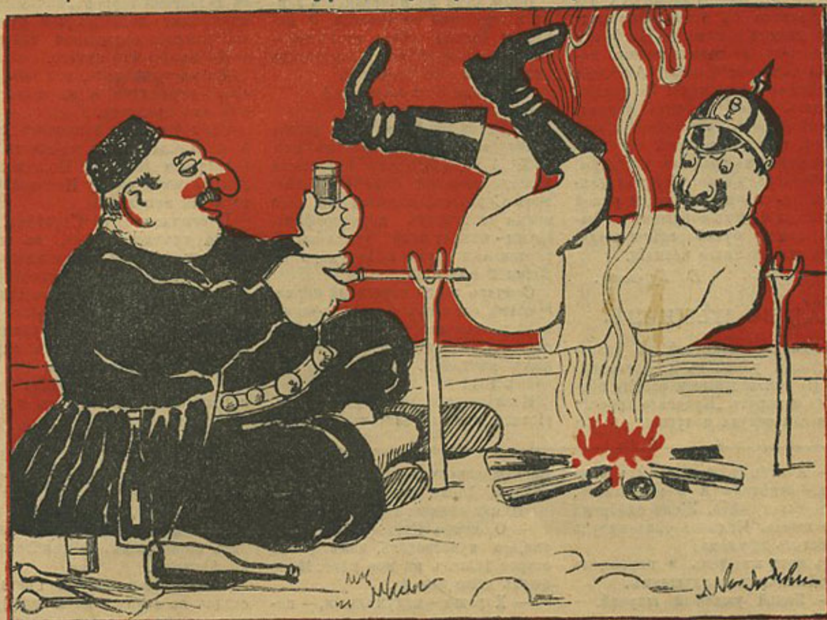
Армянинъ: Ходы, душа мой, на штынь... будетъ хорошій шашлынь!..

пирожное. Адольфъ подавился шоколадомъ, посинѣлъ и выпучилъ глаза, какъ лягушка, а ушастый Юганъ поперхнулся чаемъ и сталъ прыгать на мѣстѣ.