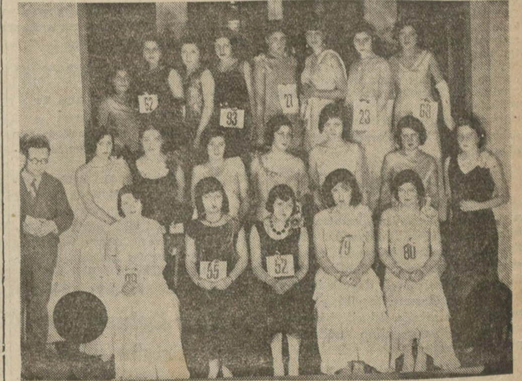
Dün müsabakaya iştirak eden hanımlardan mürekkep bir grup dım. Çıktıktan sonra da spora devam ettim. Biraz Fransızca bilirim. 20 yaşındayım. Şimdi çok yorgun ve müteheyyicim. Fazla bir şey söyleyemeyeceğim. Yalnız müsabakayı yapan Cumhuriyet gazetesine ve beni intihap eden hakem heyetine lâyezal teşekkür ederim. (Lâtfen sahifeyi çeviriniz)