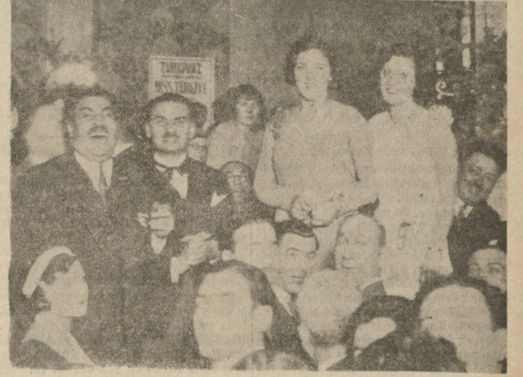
1930 ve 1931 Kraliçeleri yanyana halk tarafından alkışlanırken