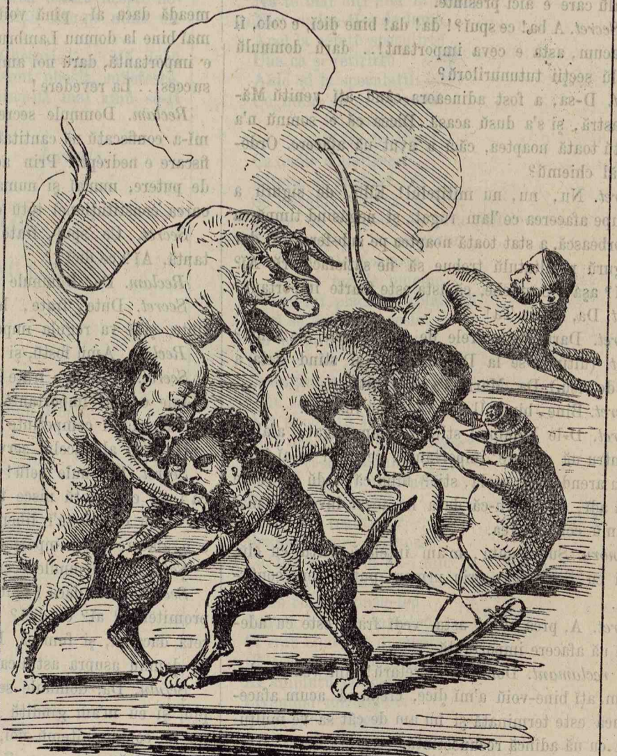
D. Cogalniceanu, nici odată n'a spus adevă- rul, decît în ședința Senatului de 5. Septem.