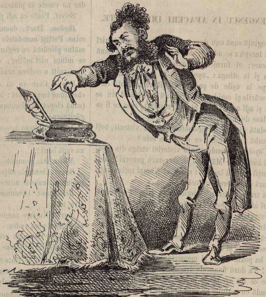
Astă țigare imperială trebuie păstrată bine și lăsat moștenire Strenepoților mei.