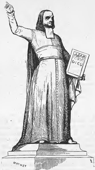
Statue de l'abbé de l'Épée, à Versailles.