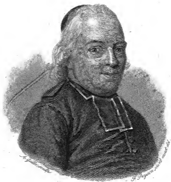
L'ABBÉ DE L'ÉPÉE.