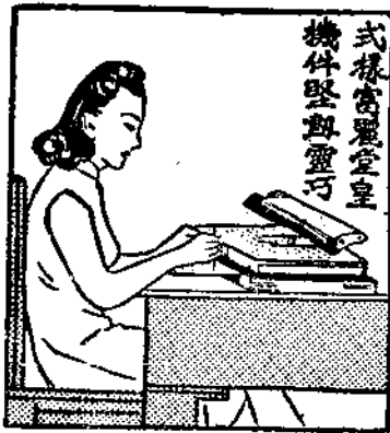
式樣富麗堂皇 機件堅固靈巧