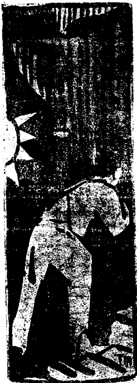
宣傳處第二十五次處務會議紀錄