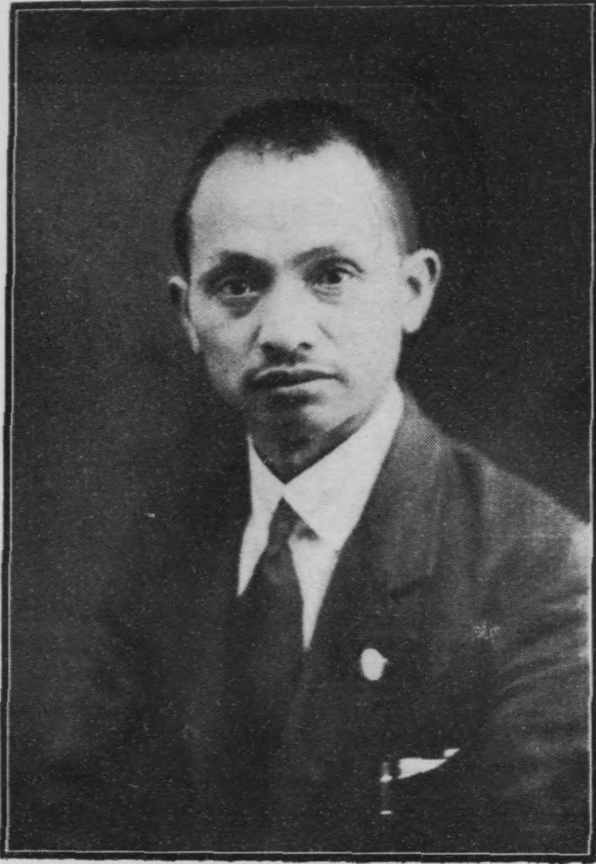
民國二十年五一節快照