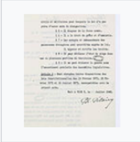
Acte constitutionnel numéro 2 2 - Archives Nationales - A-1847.jpg 822 × 960; 128 KB