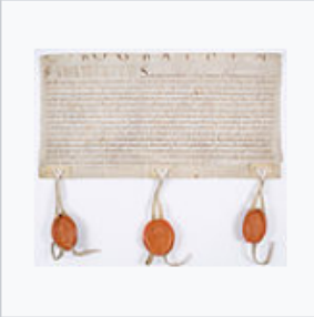
Accord passé entre Suger, abbé de Saint-Denis, et le comte de Roucy - Archives Nationales - AE-II-155.jpg 2,634 × 2,279; 1.19 MB