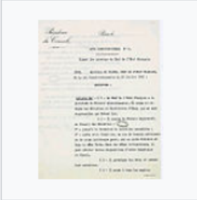
Acte constitutionnel numéro 2 1 - Archives Nationales - A-1847.jpg 924 × 1,173; 162 KB