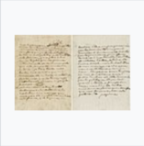
1809 Lettre Josephine a Napoleon.jpg 1,220 × 792; 360 KB