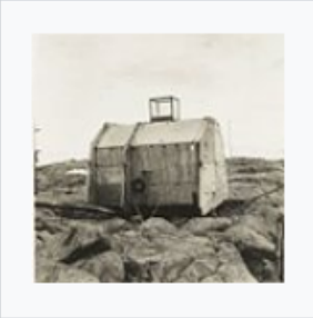
Abri observatoire en Terre Adélie- -20110210-143.jpg 1,117 × 1,102; 256 KB