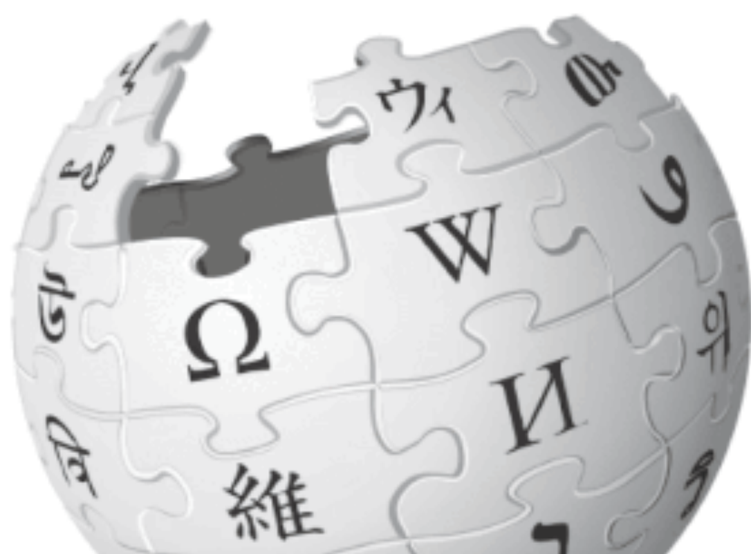
Viquitrobada 2022 Viquiprojecte Lied