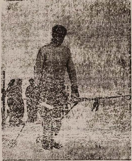
علی حضرت همایون شاهنشاهی در تپه های «تلو»

مرحوم تهران دمکراسی را حیرت زده در تپه های (تلو) دیدند شاه و گدا در کنار هم بودند