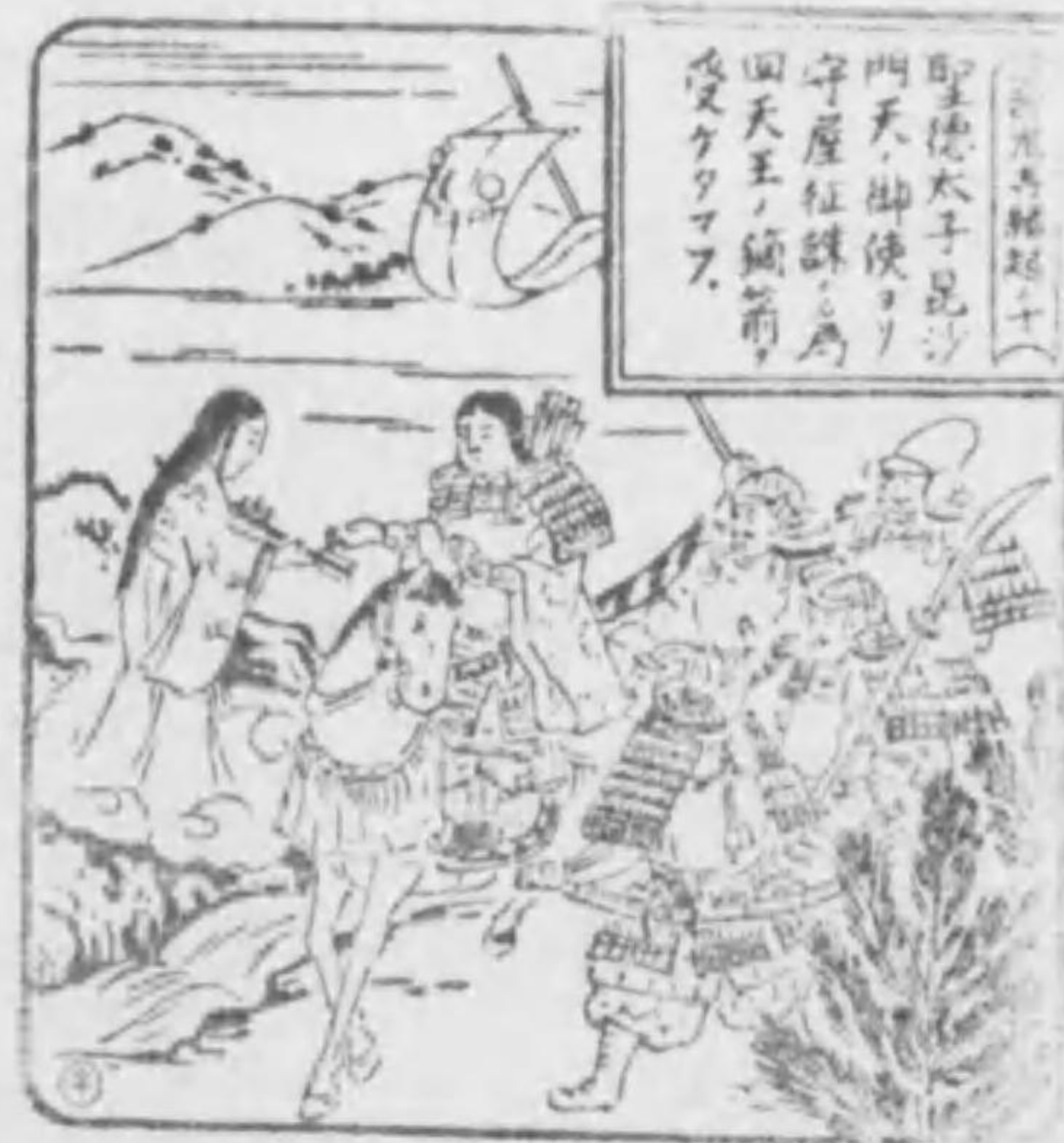
善光寺縁起 聖徳太子 四天王ノ御使 守屋ノ追手ヲ 逃レタマフ