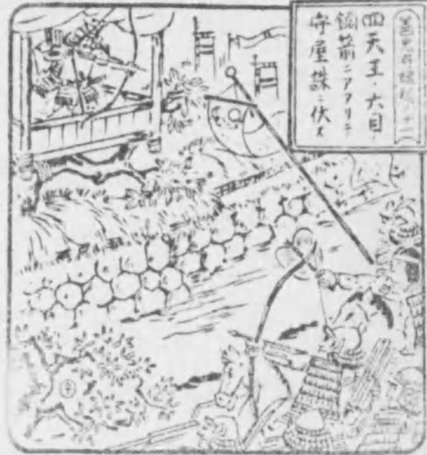
善光寺縁起 四天王・大目 鉤前ニアフリキ 守屋ノ追手ヲ 逃レタマフ