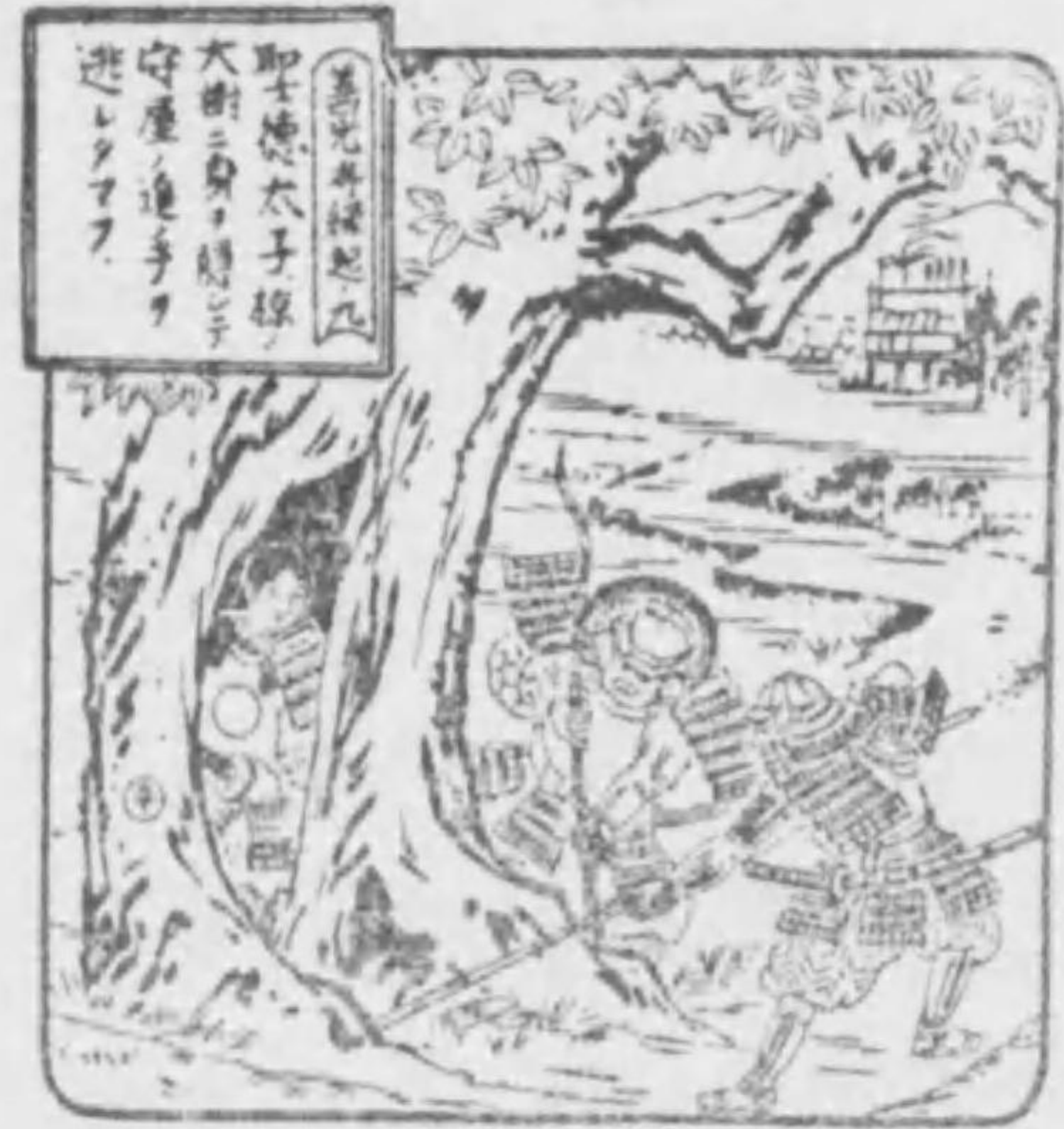
善光寺縁起 聖徳太子 大樹ニ身ヲ隠シテ 守屋ノ追手ヲ 逃レタマフ