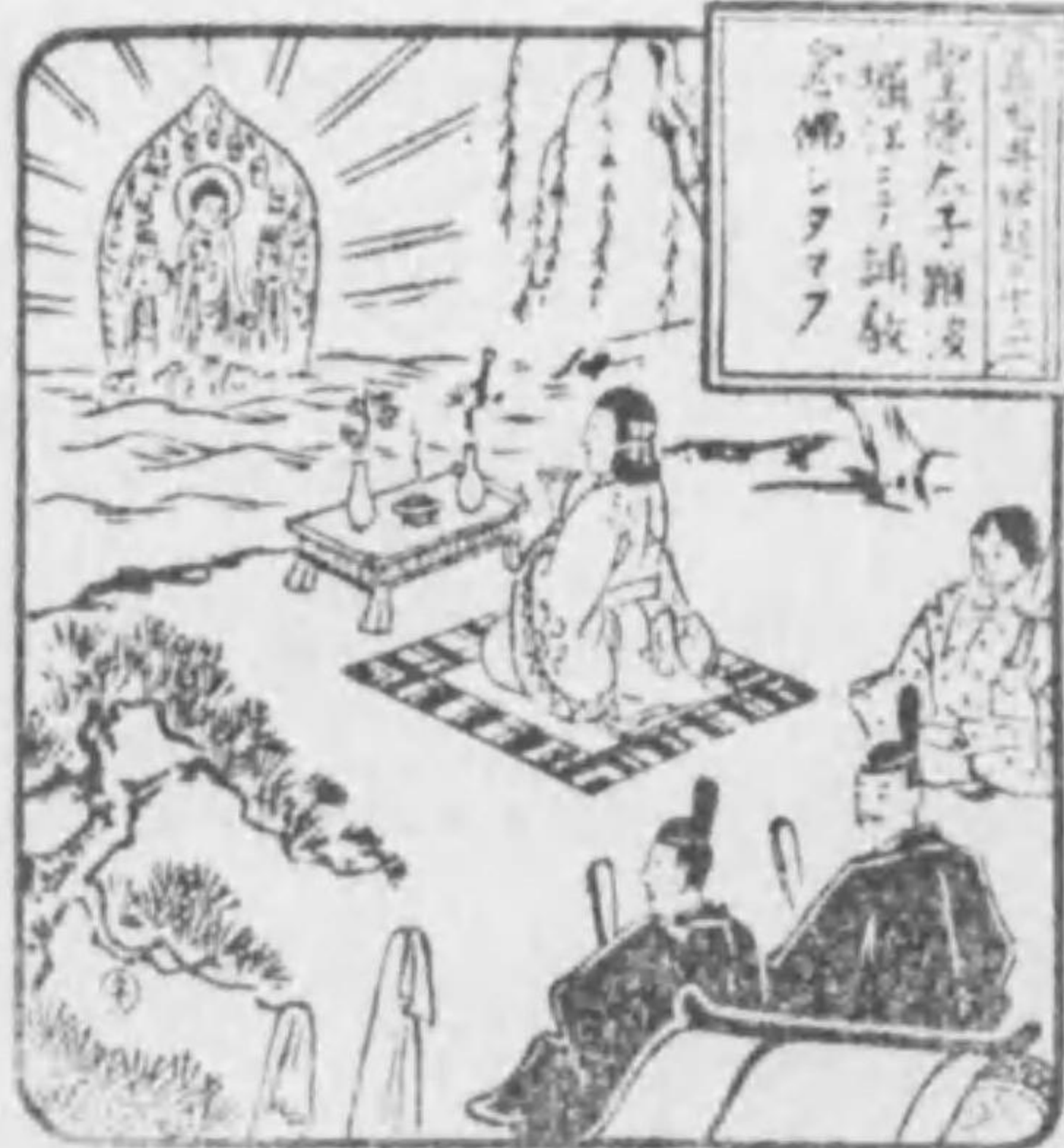
善光寺縁起 聖徳太子 堀江ニテ 念佛シタマフ