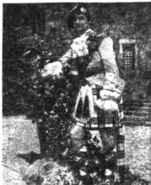
羅勃脫唐納在他的最近作品中飾一位蘇格蘭的武士之戲。他在好萊塢的最近作為 Captain Blood

羅勃脫唐納跟他的妻子第一次相遇是當他十六歲時候。兩人做了八年朋友之後才結為夫婦。羅勃脫對人說：「我第一次見到愛拉時，心裏並不喜歡她，第二次也是這樣。但是第三次却不同了。我心裏想，如果有一天我要結婚，我一定要娶她。」