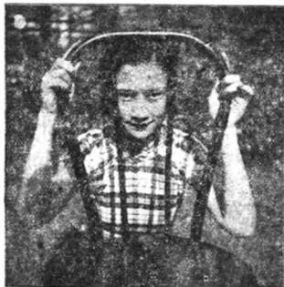
徐來離異後，片中主角的徐來，這張照片，也許她自己也沒有一個開在離異時的生活現在，可說已出。

的一封信，大意說對於現在的生活，感到厭倦了，要求跟他分離，並談及「特有財產」如何交代問題。限三天答復。