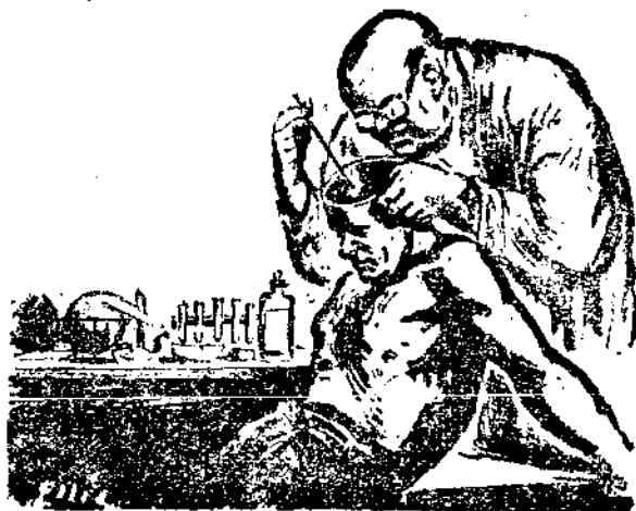
木文作者，是年青的美國人。賴聯總之助，進入「解放區」。他是農業及農業機械專家，所見的事，很足供我們了解中共統治的真相。

我和約伊在「解放區」中心——長治的小機器及木作坊內工作約兩個月。那兒專造小農具，抽的構造雖然簡單，却為中國以前所未有。我們的小作坊，有一個動人的招牌，即「太行工業研究所」，如不說規模的大小與外觀，從所表現的成就與技巧而言，那是動人的。 三間兩層的房子，低舊的門窗，三面繞以小磚頭鋪的天井。狹窄的扶梯，供我們走上樓房。扶梯下和角落堆滿舊器具、軸、飛輪、繩索，以及大小木版，天井上放着一架舊日本製彈藥車，靠牆另有兩間粗造的驢房。整天可聽到由那三間工場傳來之鋼鐵刀聲，鋸木聲，打鐵聲，和電馬達旋轉的專刺聲。 我們初幾週大半在木作坊工作，因為我們在可能內要製我們的木工具，使鄉村的木匠們易於做造。在一間騾馬