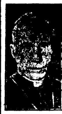
This is the message from James (Cardinal) Gibbons read at the big meeting in Washington in aid of the Near East Relief.

Relief will make to the country in February for funds to support its work among the starving peoples of that stricken land.