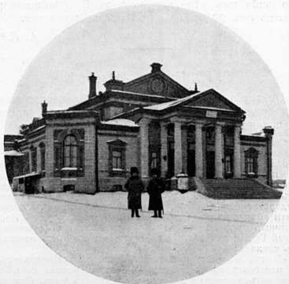
НАРОДНЫЙ ДОМЪ ВЪ ЧЕЛЯБИНСКѢ, ПРИСПОСОБЛЕННЫЙ ДЛЯ РАНЕННЫХЪ.

Вотъ на что, по нашему мнѣнію, должно быть обращено главнѣйшее вниманіе въ ближайшемъ будущемъ. Привѣтствуя всякій починъ въ дѣлѣ матеріальнаго возрожденія русскаго флота, мы во стократъ глубже, сердечнѣе примемъ извѣстіе о коренныхъ реформахъ, клонящихся къ обновленію духа личнаго состава и съ низкимъ поклономъ и благодарностью будемъ привѣтствовать того, кто сдѣлаетъ первый починъ въ этомъ дѣлѣ насущнѣйшей и первостепенной