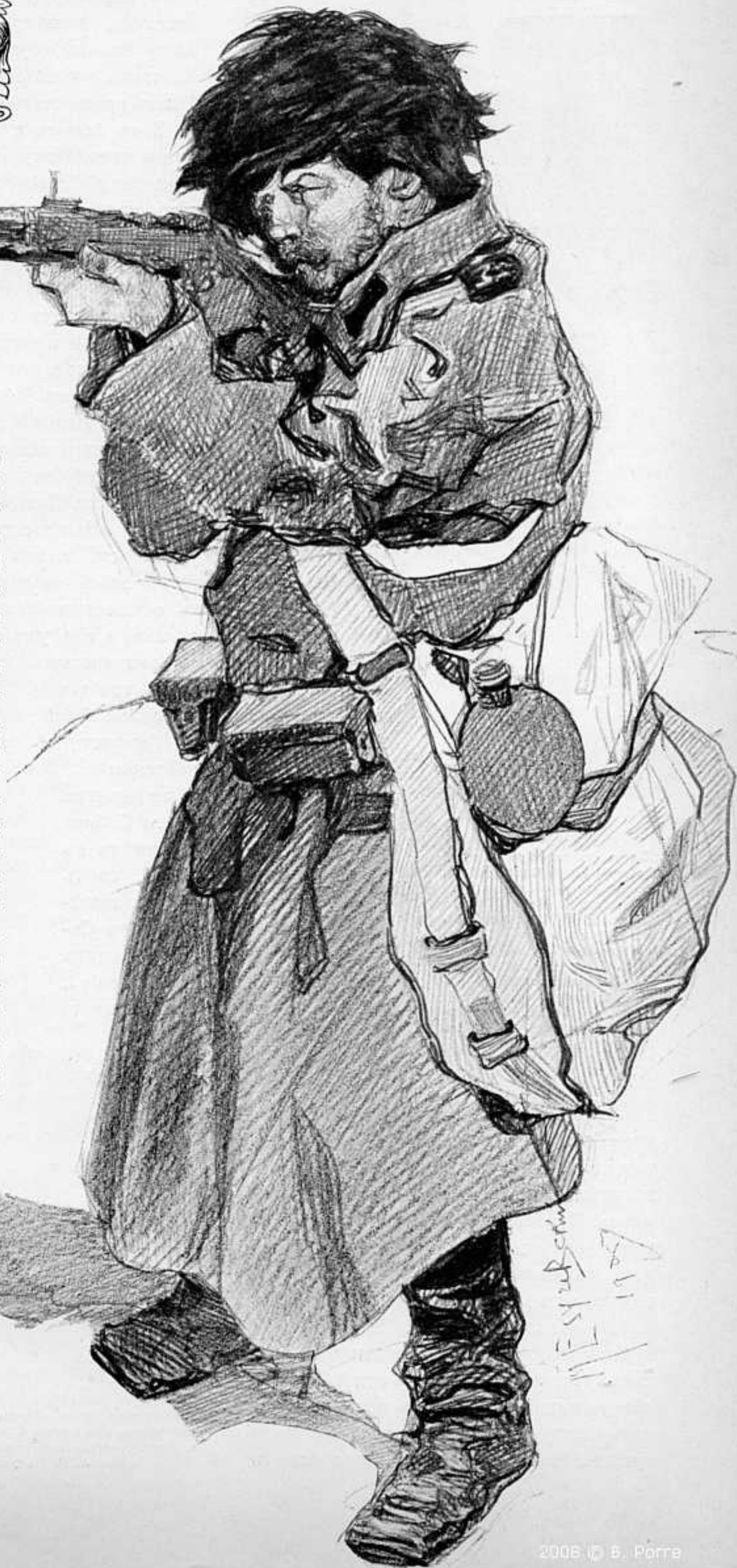
РИС. ХУД. М. ЕЗУЧЕВСКАГО. СОБСТВ. «ЛѢТОПИСИ».