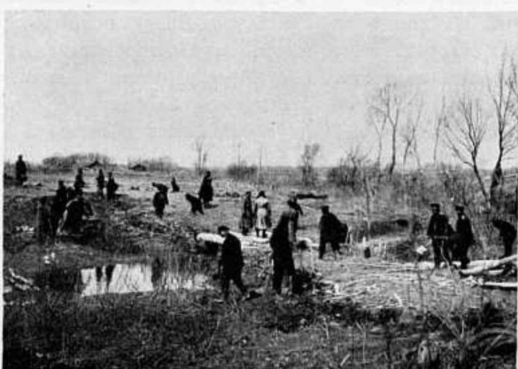
1. ОФИЦЕРЪ И ЕГО ВЪРНЫЕ СЛУГИ. 2. ВНУТРЕННОСТЬ ЮРТЫ, ЗАНЯТОЙ АДЪЮТАНТАМИ КОМАНДИРА 4-ГО АРМЕЙСКАГО КОРПУСА. 3. ПРИСПОСОБЛЕНИЕ ФАНЗЫ КЪ ОБОРОНЪ ДЛЯ ДВУХЪЯРУСНАГО ОГНЯ НА СЫПИНГАЙСКОЙ ПОЗИЦИИ. 4. ПРЕПРОВОЖДЕНИЕ КИТАЙЦЕВЪ ШПОНОВЪ. 5. ГЕЛИОГРАФНАЯ СТАНЦИЯ. 6. УСТРОЙСТВО ИСКУССТВЕННЫХЪ ПРЕПЯТСТВІЙ. 7. МОЙКА БЪЛЫЯ. 8. УСТРОЙСТВО МОСТА ИЗЪ ПОДРУЧНЫХЪ МАТЕРІАЛОВЪ.