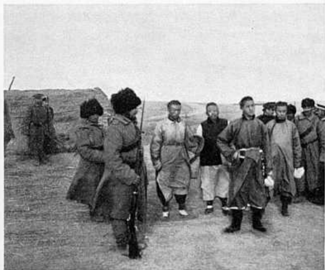
АРЕСТОВАННЫЕ ПРИ ШТАБѢ 4-ГО АРМЕЙСКАГО КОРПУСА ШПОНЫ КИТАЙЦЫ.

упрекнуть въ излишней храбрости, нежели въ ея отсутствіи. Сколько разъ я заставлялъ генерала Ренкампа въ стрѣлковой цѣпи среди убитыхъ и раненыхъ; — генерала Мищенко на батарее, осыпаемой японскими снарядами; — генерала Гернгросса—гдѣ-нибудь въ улицѣ деревни, обстрѣливаемой ружейнымъ огнемъ... Ни у одного офицера дѣйствующей арміи не повернется языкъ упрекнуть своихъ начальниковъ въ излишнемъ самосохраненіи. Достаточно сказать, что 2 корпусныхъ командира и 6 бригадныхъ генераловъ контужены, 7 генераловъ убиты (въ томъ