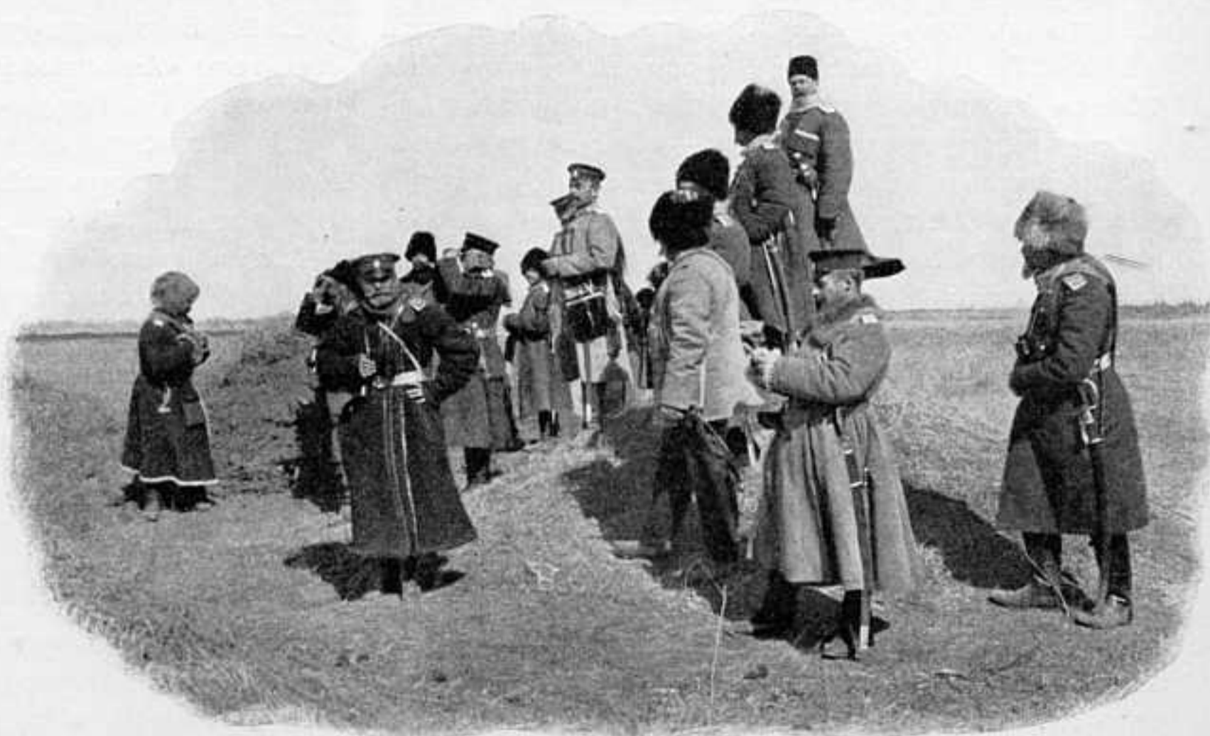
КОМАНДУЮЩІЙ 2-Й АРМІЕЙ ГЕНЕРАЛЪ КАУЛЬБАРСЪ НАБЛЮДАЕТЪ ЗА БОЕМЪ У ДЕР. ХОУТХА ВЪ ПОЛДЕНЬ 21 ФЕВРАЛЯ 1905 Г.