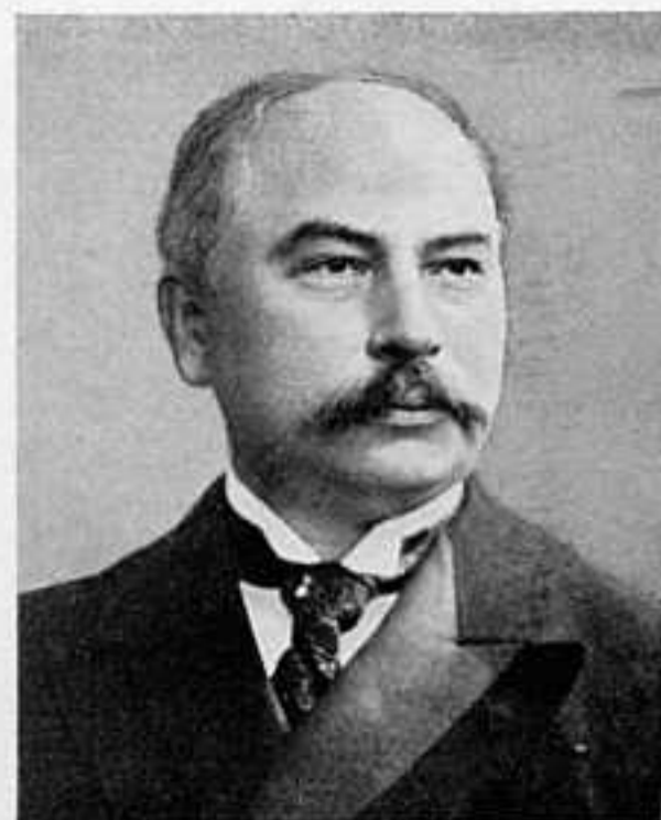
ЗАСЛУЖЕННЫЙ ПРОФЕССОРЪ Ф. Ф. МАРТЕНСЪ.

Японскій флотъ, никѣмъ болѣе не тревожимый и не отвлекаемый никакими другими задачами, оказываетъ имъ дѣятельное содѣйствіе. 4-го іюля утромъ онъ показался у береговъ Кореи, отъ устья р. Тумень до мыса Линдена, и обстрѣлялъ это устье; два миноносца вошли въ заливъ Гашкевича и пытались обстрѣлять нашъ бивакъ у с. Онгы, но были прогнаны ружейнымъ огнемъ; въ то же время въ заливъ Корнилова вошли 4 миноносца, высадили 20 матросовъ, которые и испортили намъ телеграфъ; южнѣе Онгы 4 крейсера обстрѣливали постъ у бухты Анны. Еще