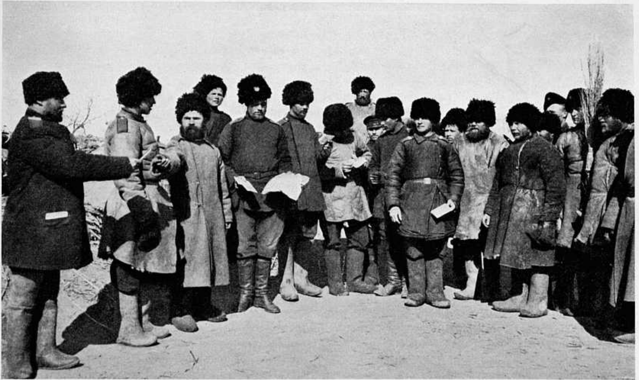
РАЗДАЧА ПИСЕМЪ НИЖНИМЪ ЧИНАМЪ 4-ГО СИБИРСКАГО КОРПУСА.

раньше, 1-го іюля 4 контръ-миноносца заходили въ бухты св. Ольги и св. Владиміра—и ушли. Изъ прибрежной полосы этихъ бухтъ жители и скоть отправлены въ горы; матеріалы, уголь, шаланды уничтожены, телеграфъ отнесенъ въ глубь материка.