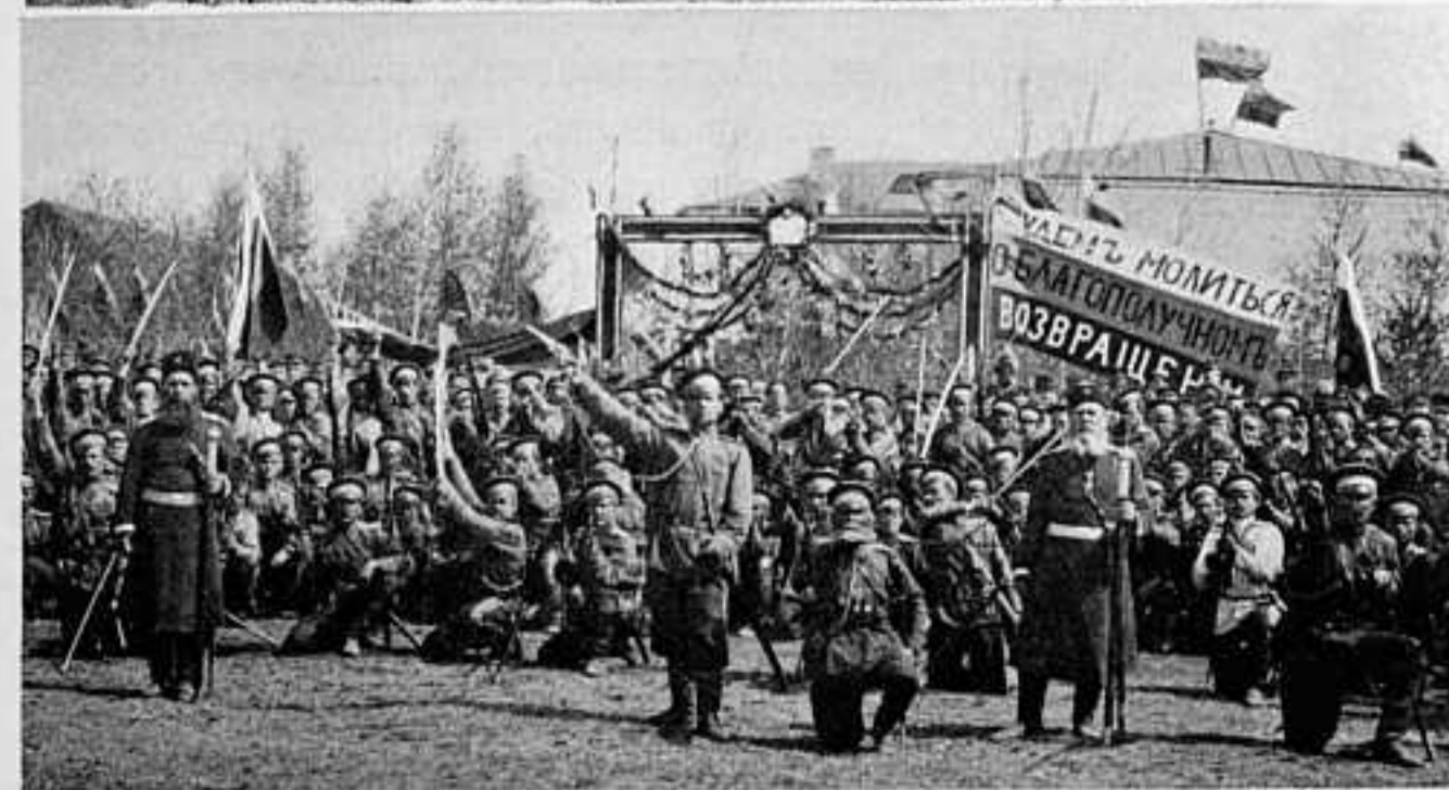
МОБИЛИЗАЦІЯ ВТОРООЧЕРЕДНЫХЪ 9-го и 10-го полковъ ОРЕНБУРГСКОГО КАЗАЧЬЯГО ВОЙСКА ВЪ ГОР. ВЕРХНЕ-УРАЛЬСКЪ.

что Россіи флотъ не нуженъ, что флотъ — дорого стоящая ей игрушка, мало кто согласится съ этимъ взглядомъ, идущимъ вразрѣзъ съ логикой, здравымъ смысломъ и всемірной исторіей, ясно указывающей, что съ потерей морского могущества утрачивалось и міровое значеніе тѣхъ государствъ, которыя имъ пренебрегали. Вспомнимъ Голландію, Испанію, Португалію. Вспомнимъ, наконецъ, что Петру Великому удалось одолѣть упорнаго врага, въ лицѣ Швеціи, только флотомъ, а Екатеринѣ Великой — такового-же на югѣ, въ Черномъ морѣ, — Турцію, также только благодаря побѣдоносной дѣятельности ея флота, находившагося въ опытныхъ рукахъ искусныхъ флотоводцевъ. Неужели мало этихъ указаній!? И неужели не видятъ полной несообразности своихъ доводовъ тѣ, которые утверждаютъ, что флотъ намъ не нуженъ потому, что въ Севастополѣ онъ былъ потопленъ во время Крымской войны, во время турецкой войны 1877—1878 годовъ мы обошлись-де и безъ него, а въ войнѣ съ Японіей утратили его почти весь, безъ остатка! Но, вѣдь не было бы Севастопольской эпопеи, если-бы въ то время нашъ флотъ былъ на высотѣ своего призванія, если бы мы слѣдили за развитіемъ техники на западѣ и, имѣя въ виду пользу государственную, не жалѣли бы затратъ, хотя и крупныхъ, но цѣлесообразныхъ, необходимыхъ для поддержанія матеріальной части нашего флота (и арміи тоже) на подобающей высотѣ!