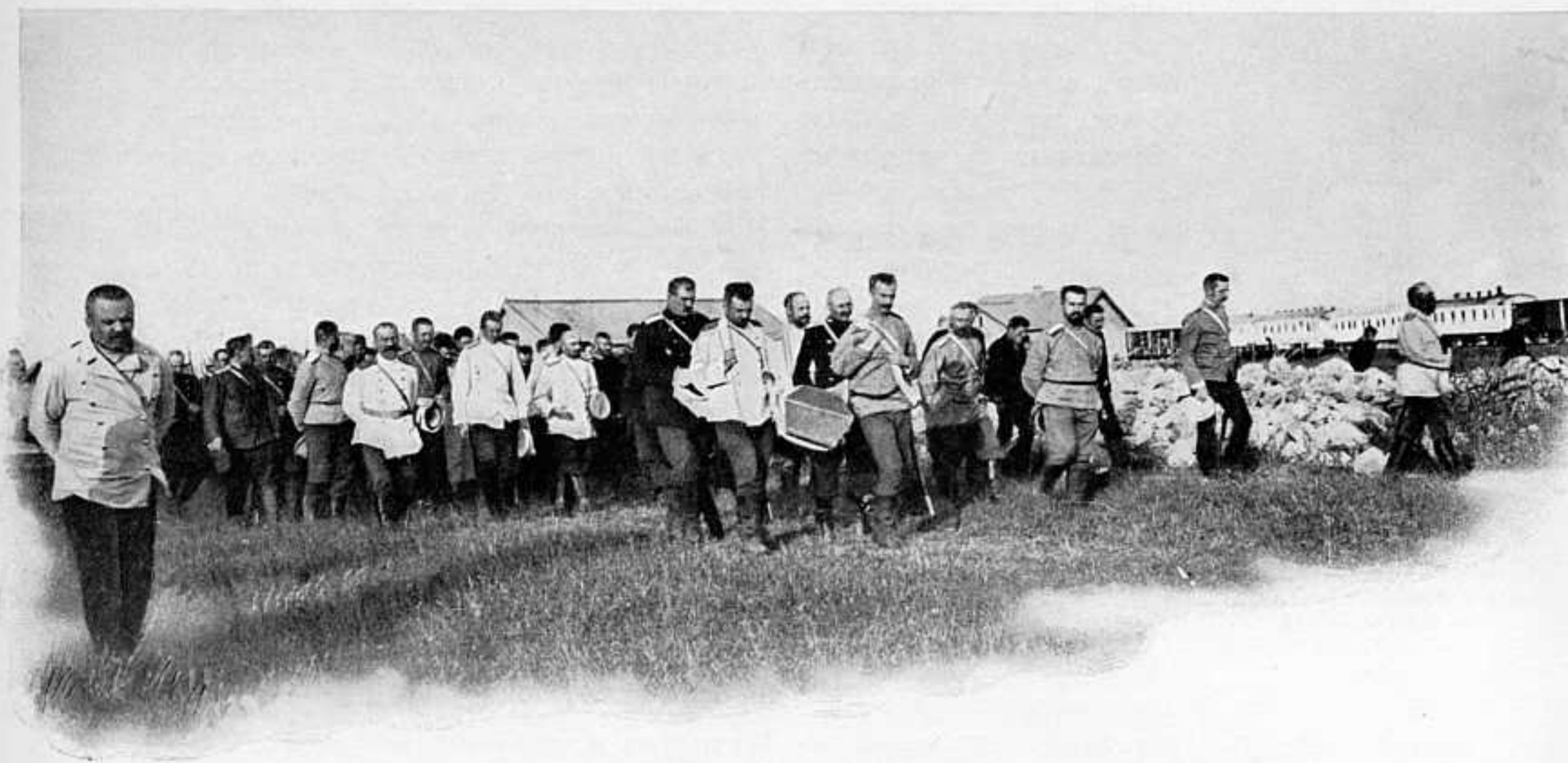
ТЕЛИНЪ. ПОХОРОНЫ ТОВАРИЩА-ОФИЦЕРА.

важности и не убоится затрудненій и препятствій, которыя будутъ оказываться въ дѣятельности его на благо нашего флота и Россіи.