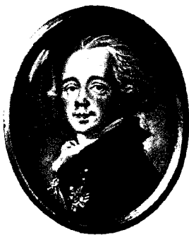
Великій Князь ПАВЕЛЪ ПЕТРОВИЧЪ (1780-е годы)

Съ миниатюры, принадлежавшей Его Императорскому Высочеству Вел. Кн. Николаю Михайловичу