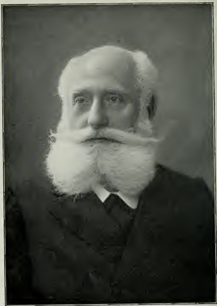
Dr. M. Nordau