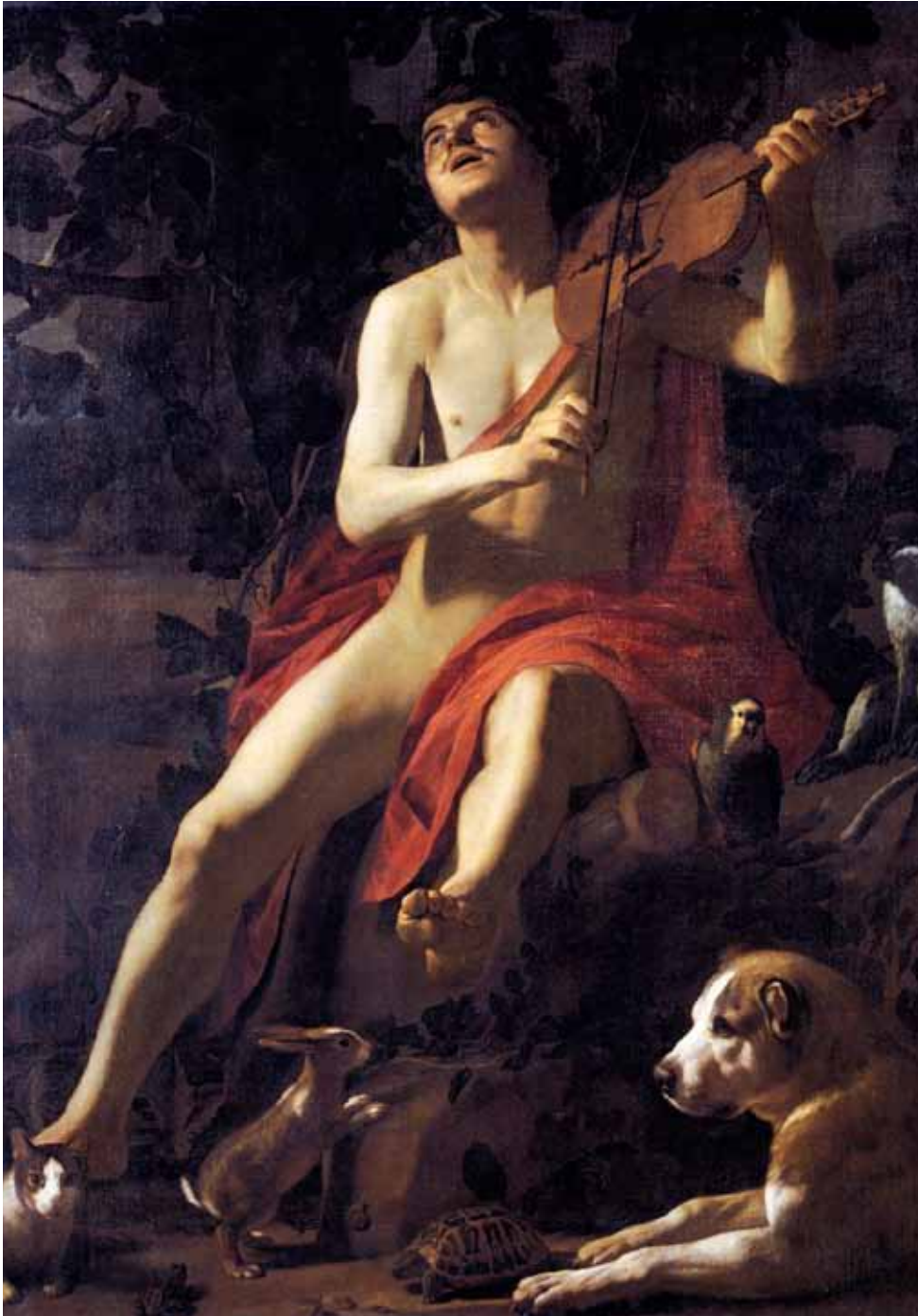
'Orpheus'. Schilderij van Gerrit van Honthorst, ca. 1614.