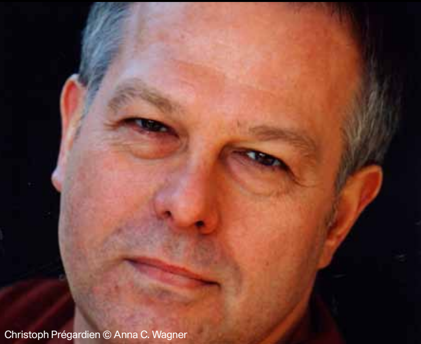
Christoph Prégardien

Concerto voor twee altviolen en strijkers in D