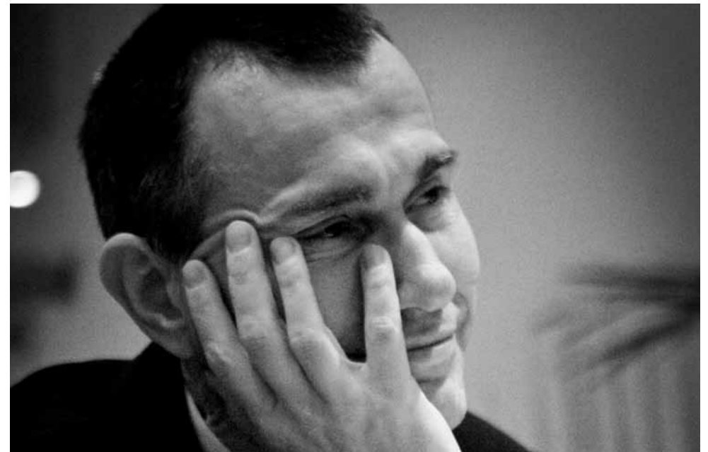
Frank Vandenbroecke

open alle dagen 9 > 24 uur informatie en reserveren +32 (0)3 237 71 00 www.grandcafedesingel.be drankjes / hapjes / snacks / uitgebreid tafelen