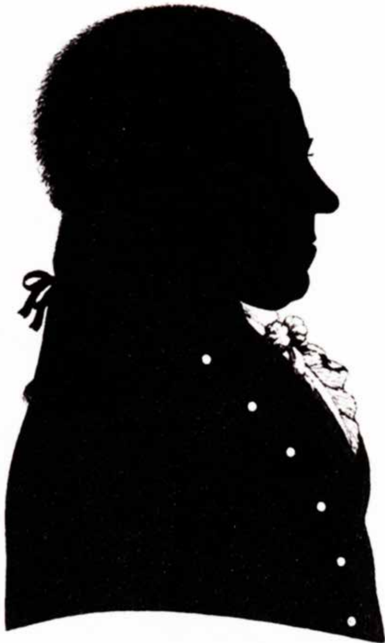
Silhouet van Anton Stadler, de klarinettist voor wie Mozart onder meer zijn Klarinetkwintet componeerde.