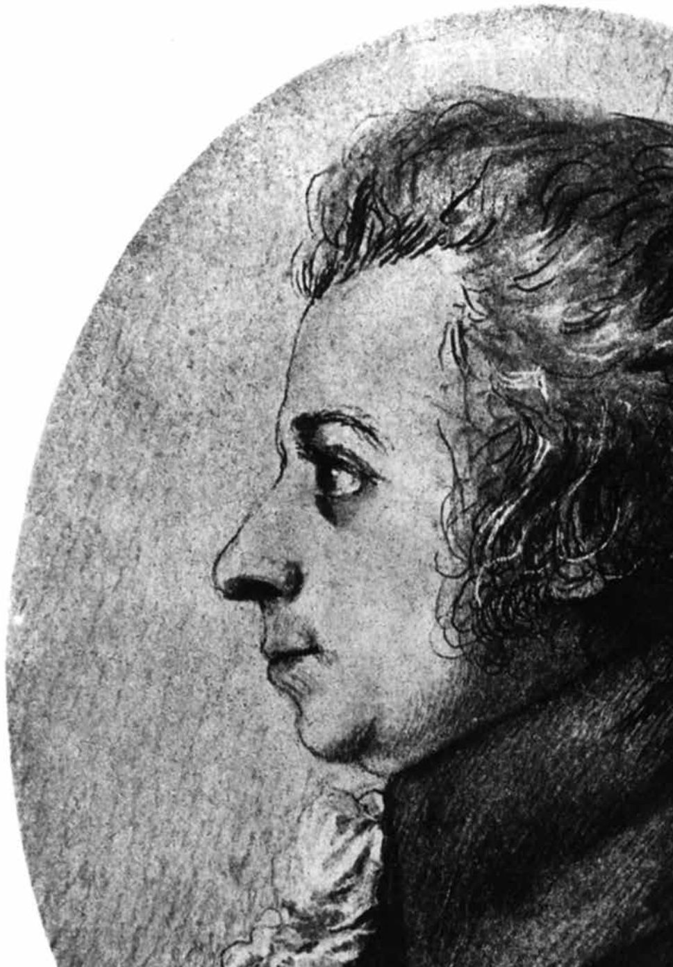
Mozart in 1789. Tekening van Doris Stock.

Het beroemde Larghetto opent met een paradijselijk sereen lied voor de klarinet begeleid door gedempte strijkers. In een tweede sectie volgt een dialoog met de eerste viool. Na een korte middensectie met stijgende toonladders voor de klarinet die uitloopt op een kleine cadens volgt een reëxpositie. Men kan zich zo een stroom visualiseren, met zuchtjes wind die het gebladerte