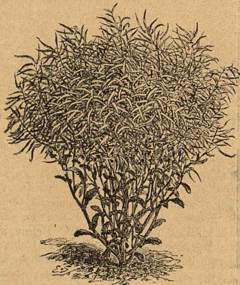
Colza de Hamburg (a se vedea articolul relativ din acest număr)

În România Colza cere mai ales un pământ care să nu fie apă multă, dar în câmpiile secetose nu prea isbutește tot d'auna. La lunci, pe lângă păduri; în fine în un loc unde clima să fie cam umedă, Colza a îmbogățit pe mulți cultivatori. Nu e vorba că și ia a sărăcit multe pământuri unde s'a semănat într'una, în toți anii în același loc. Un proprietar căruia i e milă de pământul său și mai ales la noi unde nu îngrășăm și nu