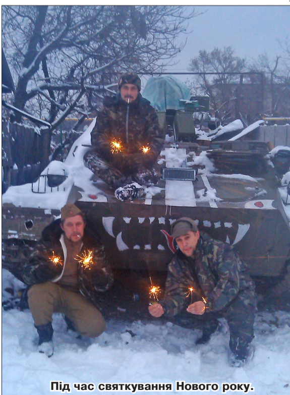
Під час святкування Нового року.

І тут помічаємо, що дорогою у сторону Донецька рухається ворожа техніка, два БМП почали стріляти по нашій чотириповерхівці. Та, на щастя, підтяглася наша артилерія, почали відстрілюватися.