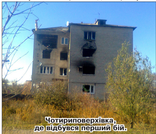
Чотириповерхівка, де відбувся перший бій.

Розподілили нас по периметру села. Нашій бригаді дісталася ділянка біля розбитої чотириповерхівки, у якій вже ніхто не жив, більш-менш уціліла лише однокімнатна квартира на першому поверсі, де ми і розташувалися. Свою бойову машину заховали за цей будинок. Так потихеньку і жили, спочатку нібито мирно. А одного ранку си-