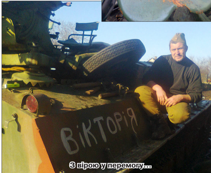
З вірою у перемогу...

дивитися, як гинуть ні в чому не винні люди. Медична допомога теж залишає бажати кращого. Якщо когось поранило і викликаємо «швидку», то вони говорять: «Може, ви самі привезете»... Лікарня ж знаходиться у м. Кураховому, половина населення якого — сепаратисти, то самі розумієте, яке ставлення до нас і до наших поранених.