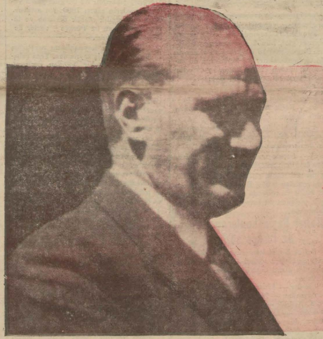
Türk budununun ulu önderi bütün değişimlerimizde olduğu gibi dil savaşında da bize atılışın ileriliğini verdi, öncülüğünü yaptı