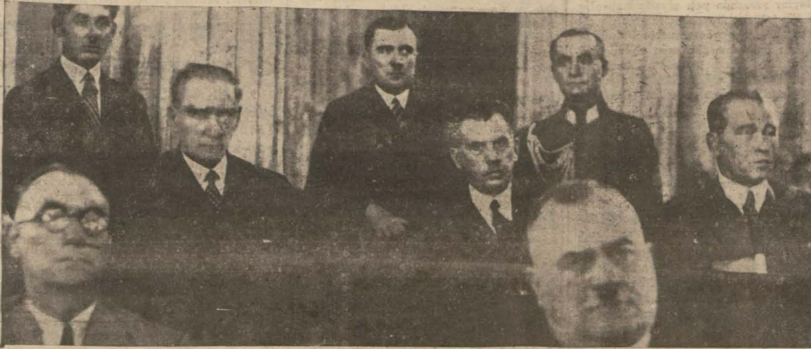
Bugün birinci Türk dili kurultayının ikinci yıldönümünü kutluyoruz. Bu fotoğraf birinci kurultayın özülü ve atımlı bir durgusudur. Büyük önderimiz Gazi Mustafa Kemal Hâzretlerinin kurultaydaki konuşmaları gittiğini gösteriyor

İkinci Öz Dil kaynağı olan eski yazılardan en ileri gelirlerinden 150 tanesi birer birer tarandı. İçlerinde bulunan öz Türkçe (Devamı 2 inci sahifede)