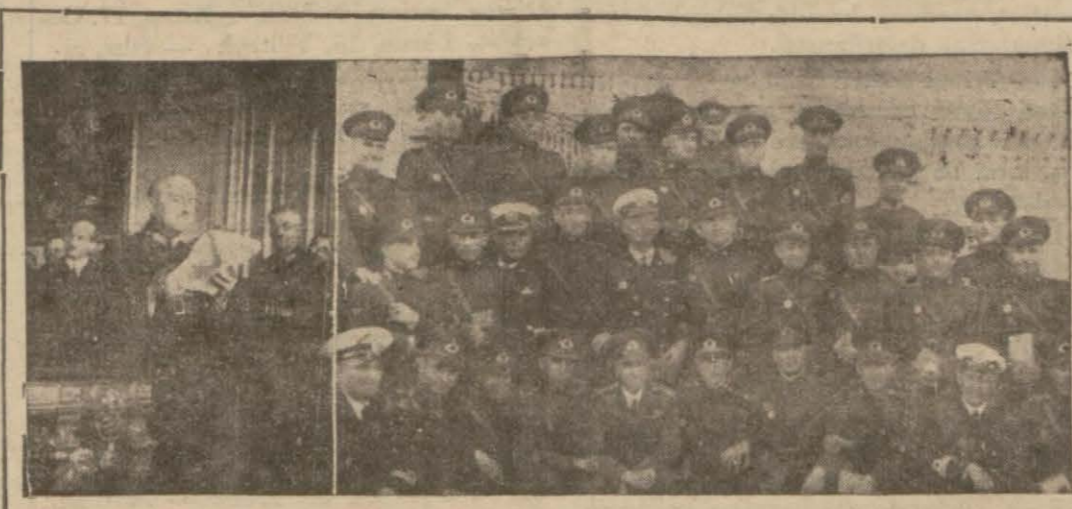
Fotografılar: «Erkânı harbiye akademisi», sini bitirenler ile akademi kumandanı Ali Fuat Paşanın sözlerini okuyuşunu gösteriyor

Sayı yazıları değiştirilirken o günün Maarif Vekili olan Yahyayanmış Necati (Devamı 2 inci sahifede)