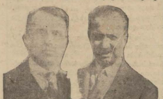
Başkan Saffet ve başyazgan İ. Necmi Beyler malarda senlik, benlik kaygusu olmamalıdır. Olursa o iş ilkinden bozuk demektir. Büyük öndere gelinceye dek hep böyle senlik, benlik kaygusuyla yazılan yazılardan bir iş görülemezdir. İşte bundan dolayı biz burada dil savaşına Gazinin kutlu elini bu işe koydu-

ğu günden başlayacağız. Bu da altı buçuk yıllık bir geçmiş demektir.