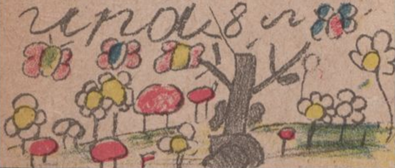
СЕРЕЖА. БАРАНОВ. 8 ЛЕТ