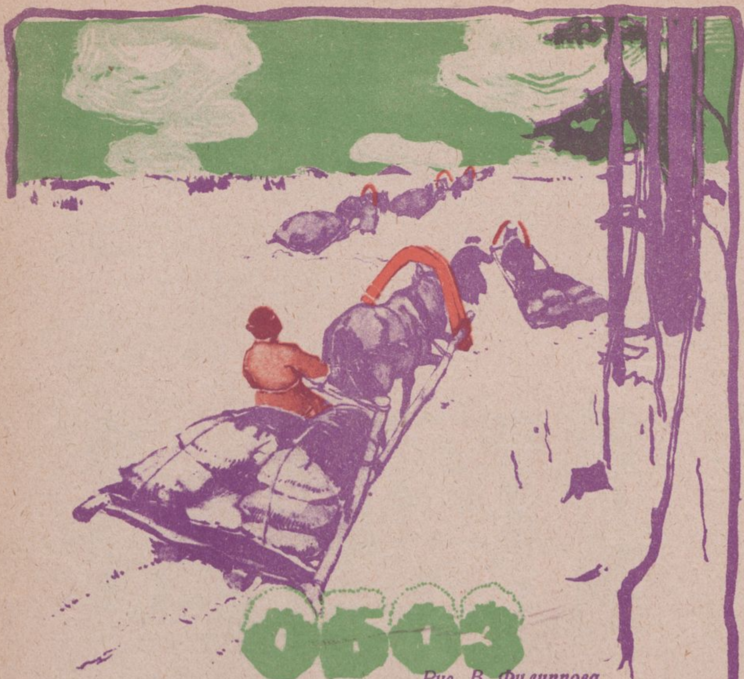
Рис. В. Филиппова

Из деревни в город Крепкая дорога. Собирались в пору, В сани клали много. По ухабам, в гору Поднялся обоз. — „Что везете в город?“ — Лен, пшено, овес!.. Белым одеялом Смотрит санный путь... Вон, на постоялом, Надо отдохнуть.