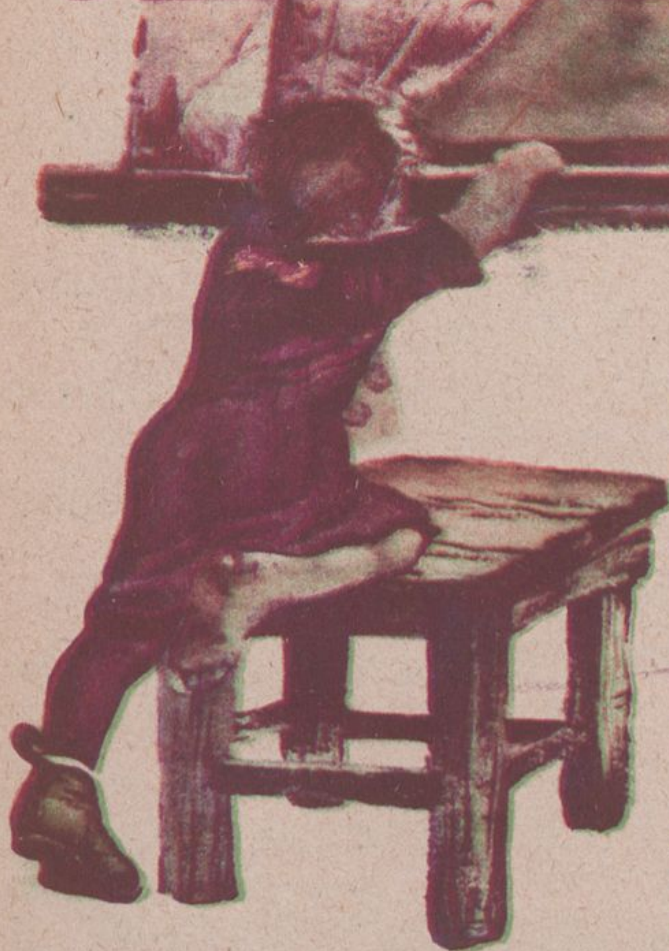
Рис. П. Малькова.