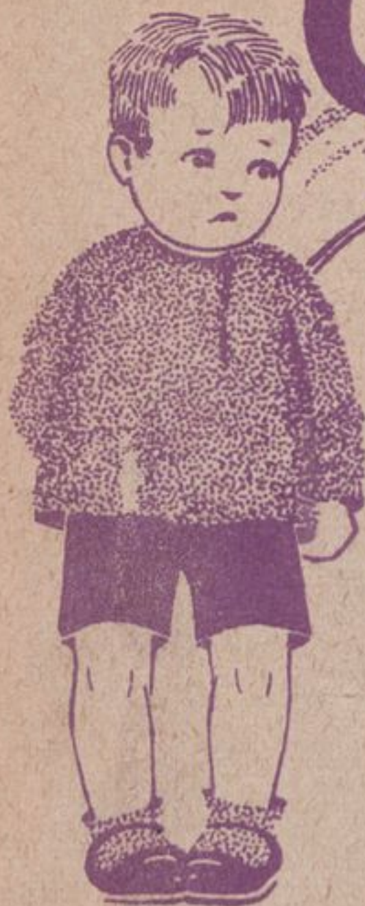
Рис. Т. Лемар.

Наступают Октябрьские торжества. У Васи в школе работы по горло. Ребята украшают свой клуб. Клеют, пишут плакаты, рисуют.