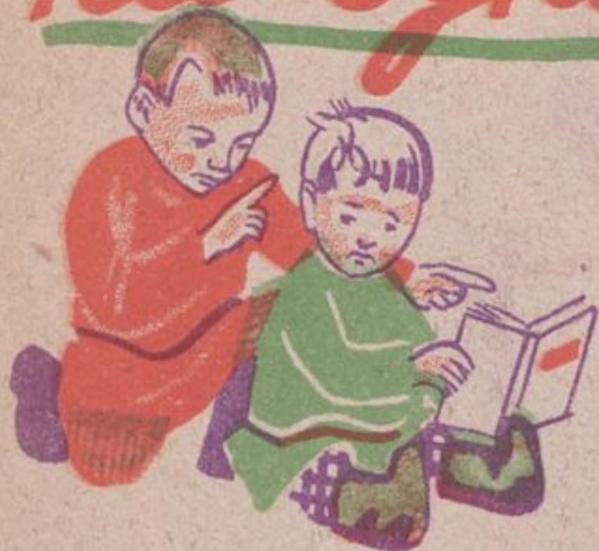
Рис. Д. Мощевитина.

Леша даром что первый год в школу ходит, а живо мать свою обучил грамоте. Мать рада. Мало ли что записать бывает надо, — теперь она это может.