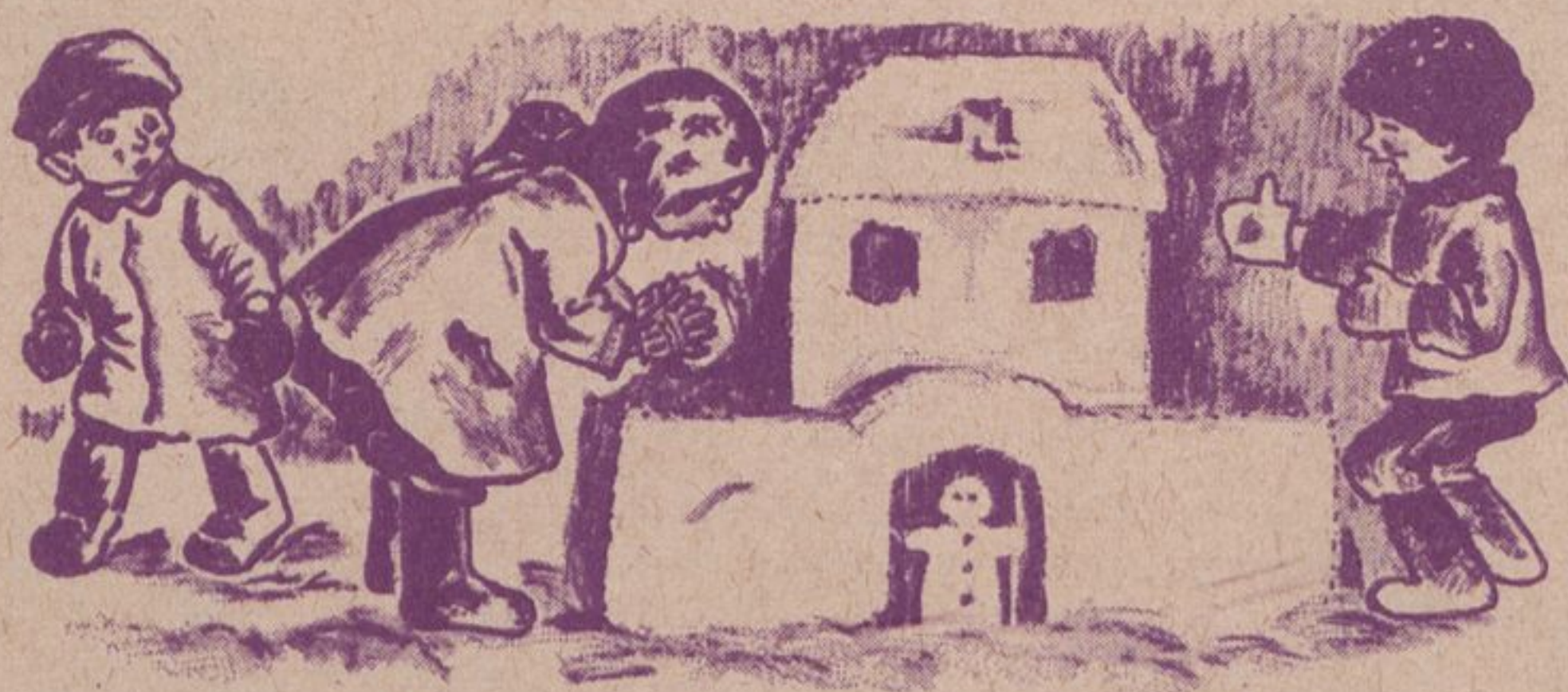
Рис. А. Соборовой.

Ну-ка, В руки Снежный ком: Будем строить Снежный дом! Мы польем его водой, Дом наш будет ледяной. Ком за комом Мы кладем, Вырастает