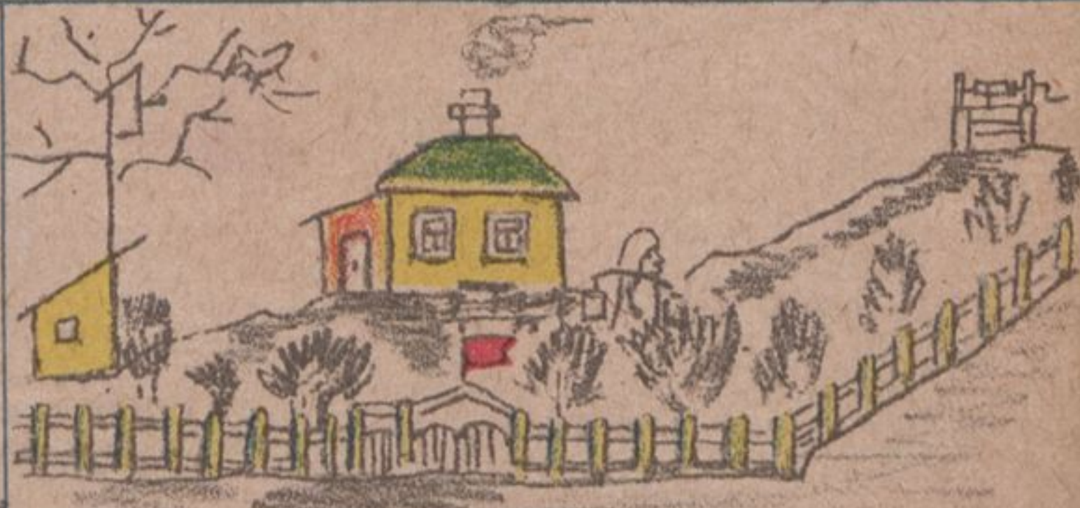
ВИТЯ КАЛАЧЕВ 8 ЛЕТ