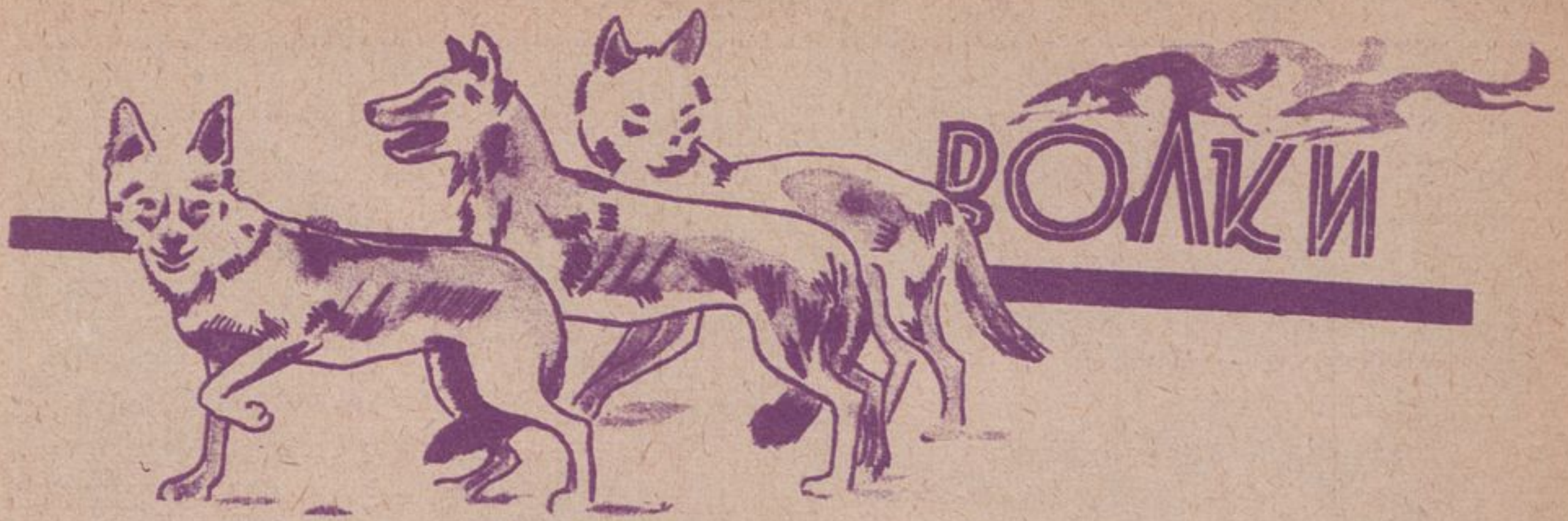
Рис. В. Штраниха.