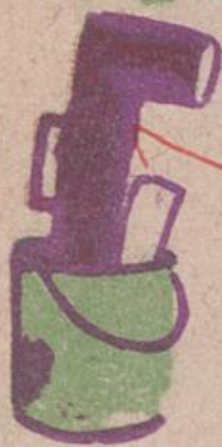
Рис. Д. Мощевитина.

Гвоздик на буфете. Ниточка под стол. В пять минут наш Петя Радио провел.