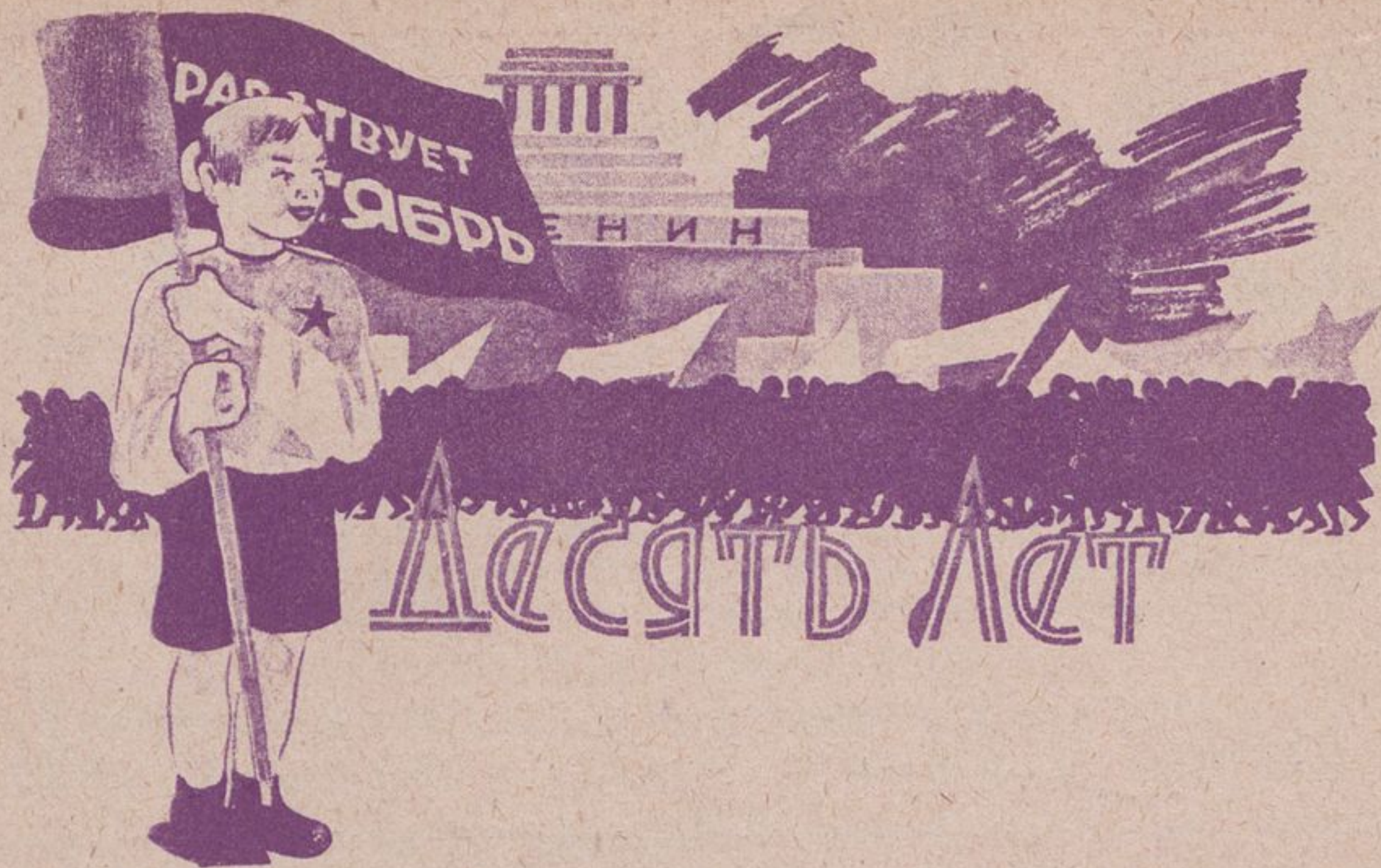
Рис. В. Штраниха.

Весь город флагами одет... Октябрьский праздник. Всюду песни. А мне сегодня десять лет, Я Октябрю ровесник.