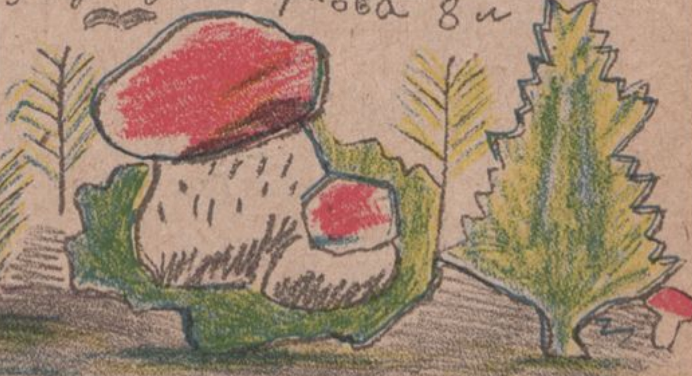
Уддй. Поликарпова 8 лет