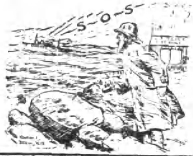
Hope from the West — (from Weekly Independent) (1921) — 〈希望降自西方〉 歐洲快要沒落了，緊急的當兒正在大 聲疾呼求救命 愛爾蘭獨立週報 Dublin

，同到有見解的僱主，都曾注意到這一點的重，所以到在會議中特別的專案提出討論過，當時所感到的困難就是先決的經費問題，而且還有更重的是創辦者的主體，應該國立呢？還是官商合辦呢？在審查會討論了很久，沒有得到具體的決定，後來到了大會的時候，這事件就議決交給各省市市政府去酌量辦理，同樣的，省市市政府方面，也因為經費的關係，結果也是