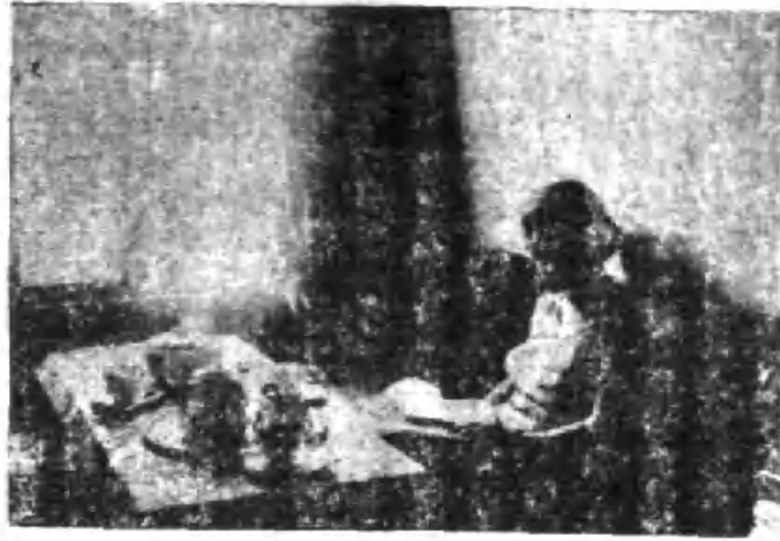
室客會式車之社支京東社本

走吧，我走到了家裏，把溼透了的襯衫脫去，我就連忙的奔向露天台上，涼人的夜風吹得我全身舒暢，忽然我看見先施，新新的燈塔，呵