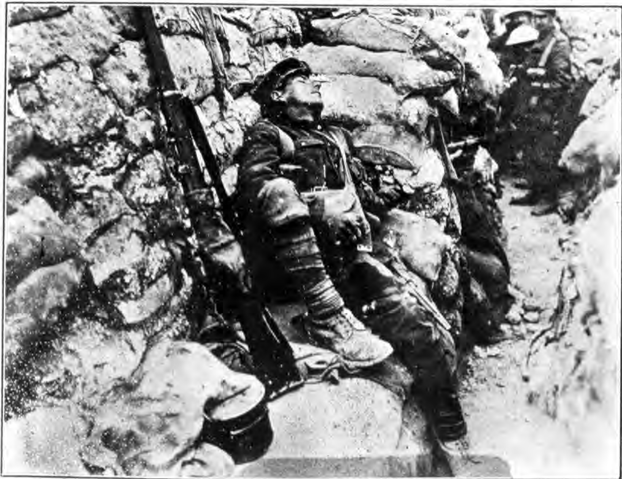
錫泊伐爾附近三丈英軍壕戰中軍士倦極就睡之圖