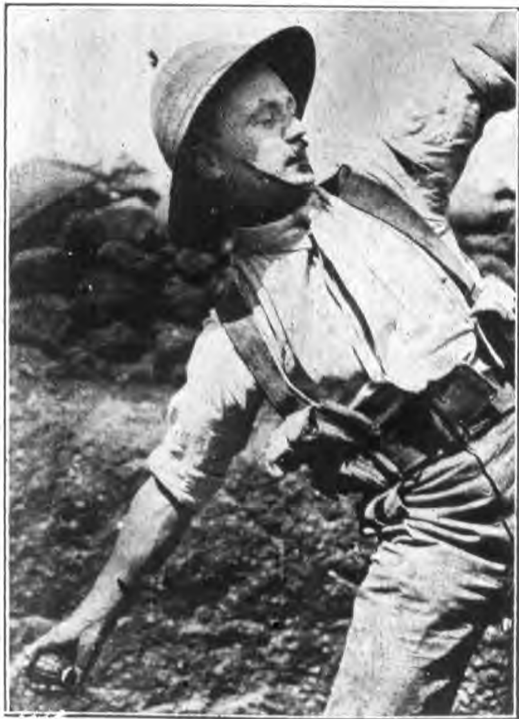
圖之彈榴放擲人軍國英