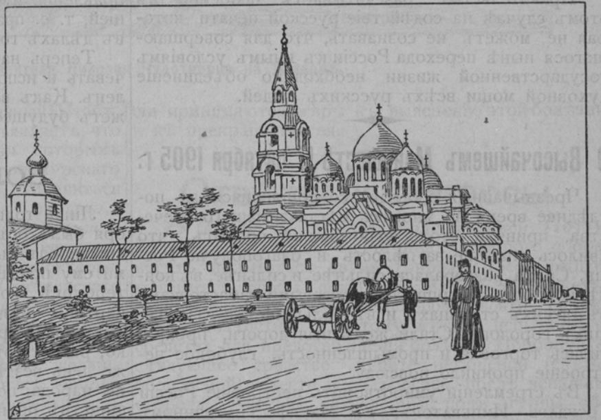
Новый соборный храмъ въ Валаамскомъ монастырѣ во имя Преображенія Господня, заложенъ въ 1887 г. оконченъ въ 1889 г.

Телеграмма Государственнаго Совѣта, подписанная Предсѣдателемъ и всѣми присутствовав-