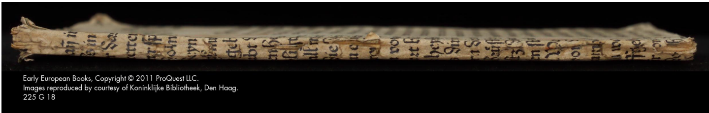
Early European Books, Copyright © 2011 ProQuest LLC. Images reproduced by courtesy of Koninklijke Bibliotheek, Den Haag. 225 G 18