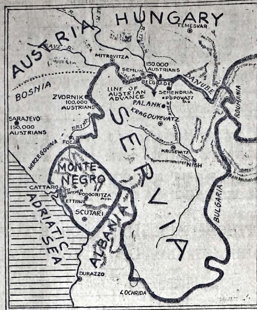
МАПА АВСТРИЙСЬКО-СЕРБСЬКОЇ ВІЙНИ.

Російський цар Никола II, видав воєнний маніфест, в яким передівсім без