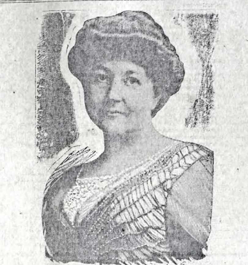
Бл. П. Елена Вілсона, жінка президента Вілсона.