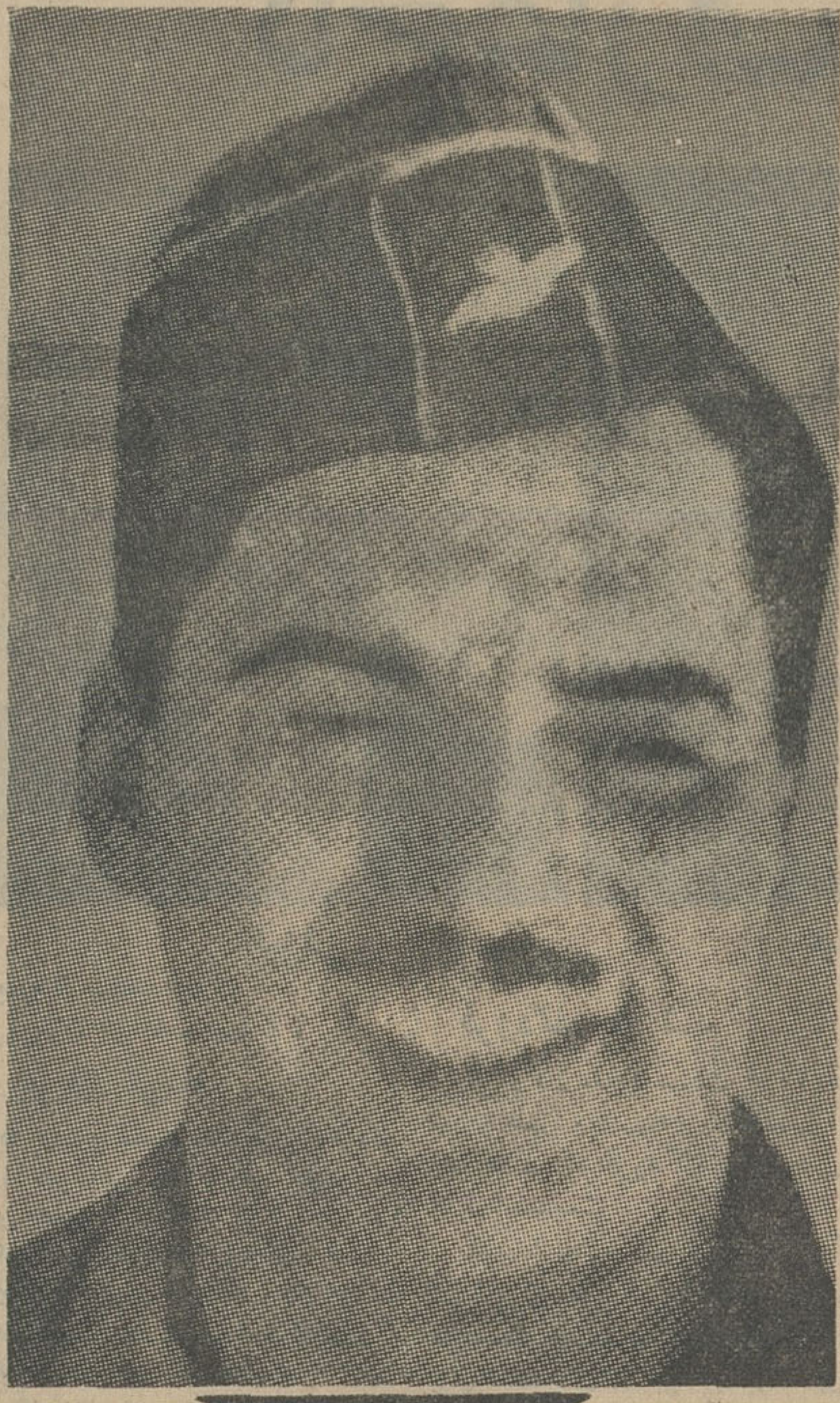
عبدالرزاق رهبر کودتا دستگیر شد

خبر گزاریهها گزارش میدهند جنگ شدیدی در نقاط مختلف عراق در گرفته است