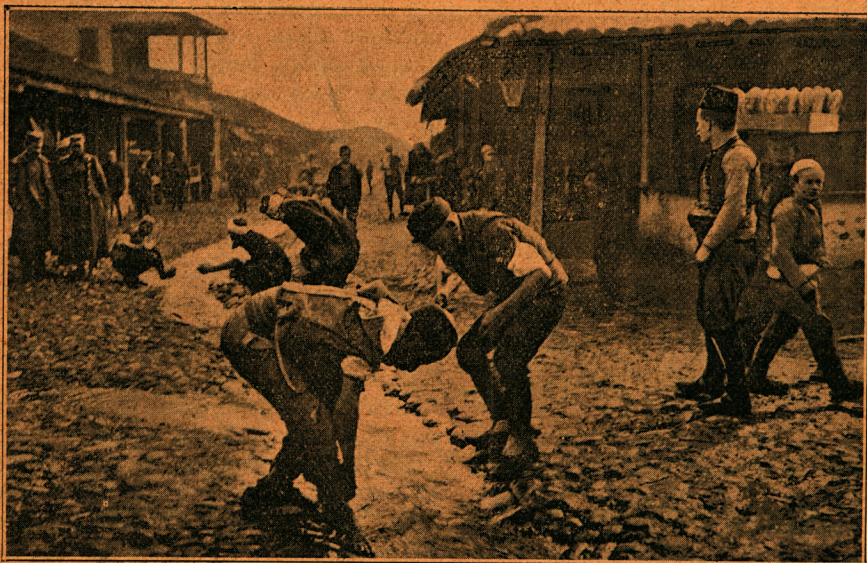
На потоку који протиче кроз улице Новог Пазара Турци узимају Авдос пре молитве.

Па ипак се и поред свега њихо-вог терорисања „српска слава“ тако лепо очувала у овим крајевима да