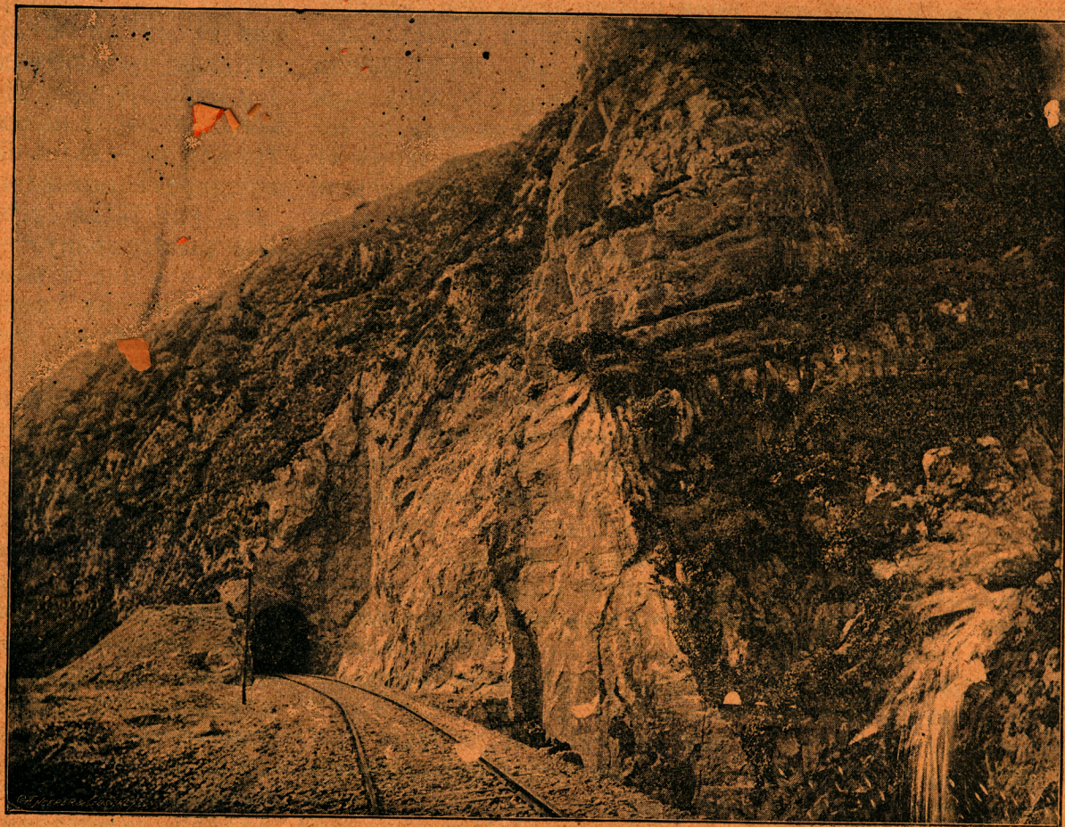
Српска жељезница кроз Сичевачку клисуру