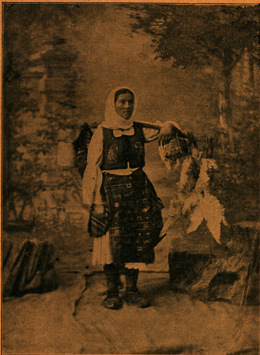
Српска народна ношња: