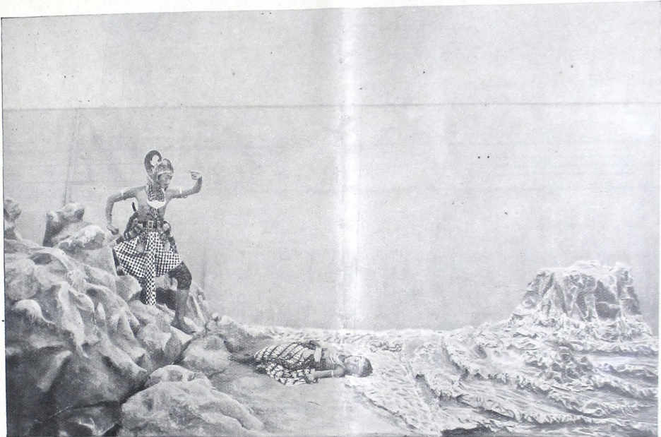
រូបភាពនៃប្រទេសកម្ពុជាដែលបានកើតឡើងនូវស្ថានភាពដ៏ស្រស់ស្អាតនៃប្រទេសកម្ពុជា។

ប្រយោជន៍ដ៏ល្អនៃប្រទេសកម្ពុជា បានកើតឡើងនូវស្ថានភាពដ៏ស្រស់ស្អាត នៃប្រទេសកម្ពុជា។ យើងបានឃើញ នូវស្ថានភាពដ៏ស្រស់ស្អាតនៃប្រទេស កម្ពុជា។ យើងបានឃើញនូវស្ថានភាព ដ៏ស្រស់ស្អាតនៃប្រទេសកម្ពុជា។