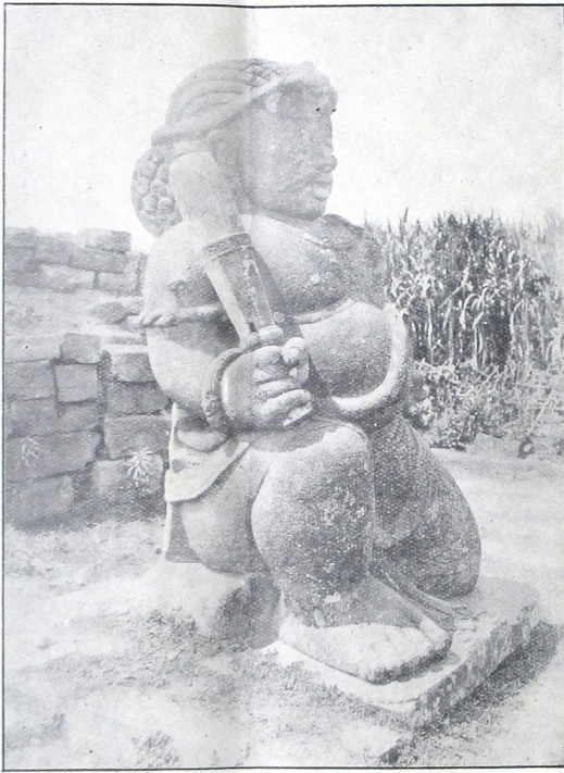
ප්‍රභූතයන්ගේ ජීවිතයේ ප්‍රධාන අංශයක් වන බව