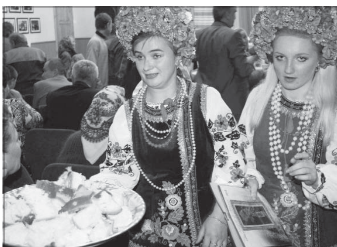
Пригощали короваєм, пивом, квасом...