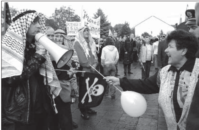
Так провокатори намагалися зірвати зустріч Арсенія Яценюка в Ужгороді.