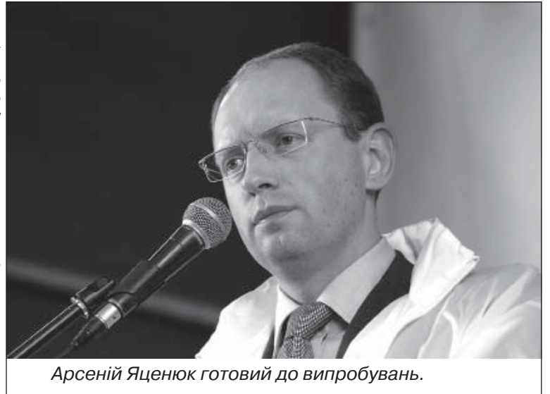
Арсеній Яценюк готовий до випробувань.