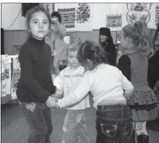
Співали й танцювали не лише на сцені будинку культури, а й в залі...