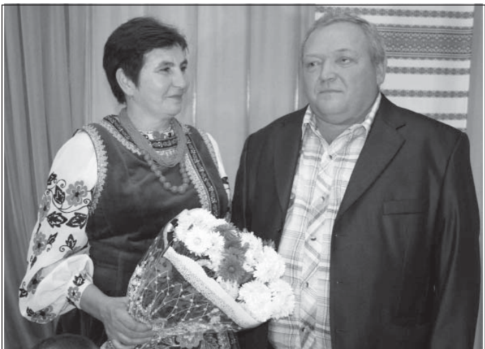
Громада вшанувала родину Гуменюків, які 30 років віддали роботі на культурній ниві.