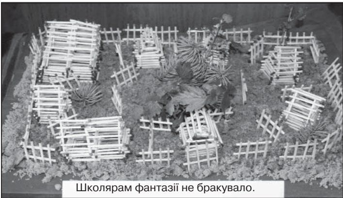
Школярям фантазії не бракувало.