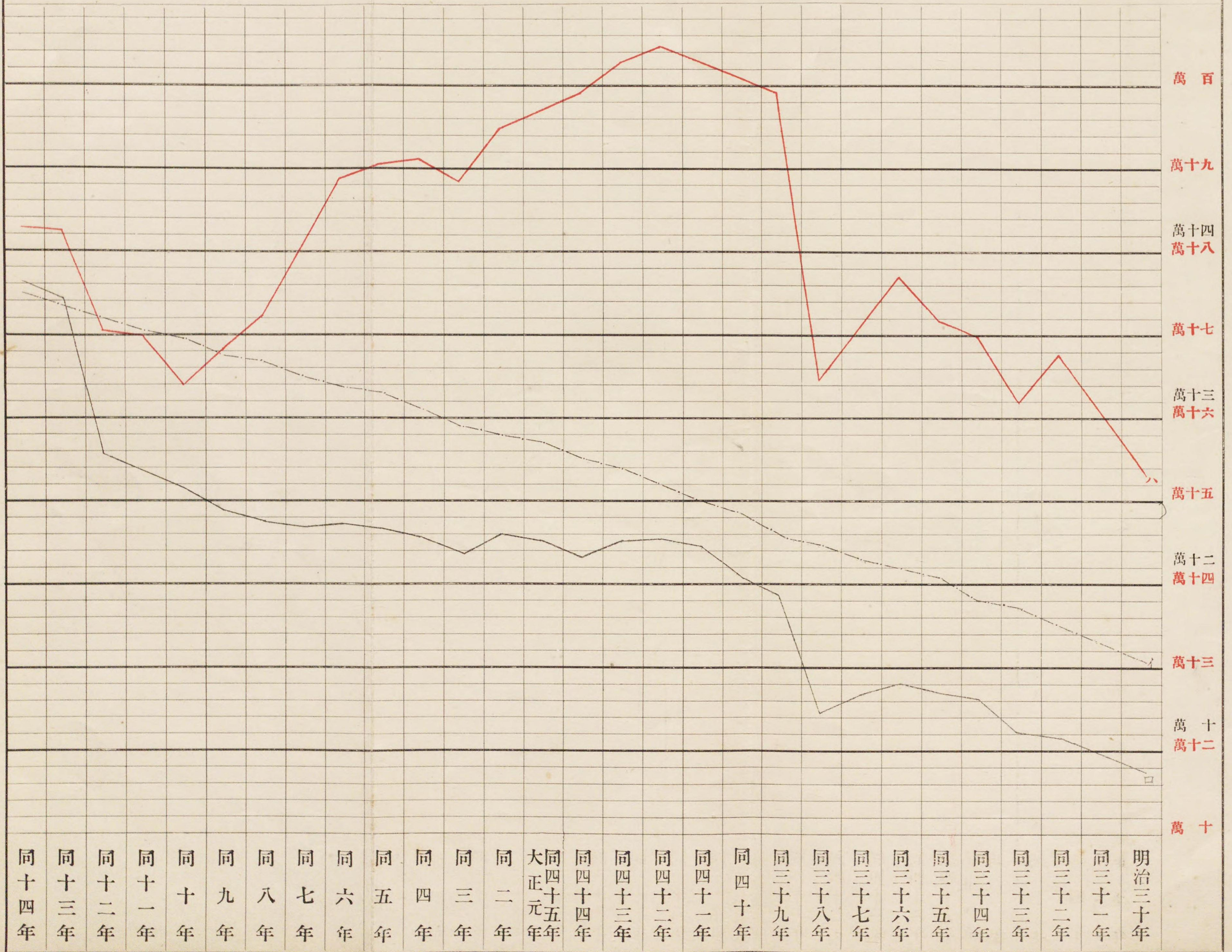
藏書及閱覽人員貸付圖書數一覽表 イロハ 藏閱人員數 書目盛員數 貸付圖書數 但目盛員數 シハ盛員數 付圖書數 圖書數 ノ覽ノスト