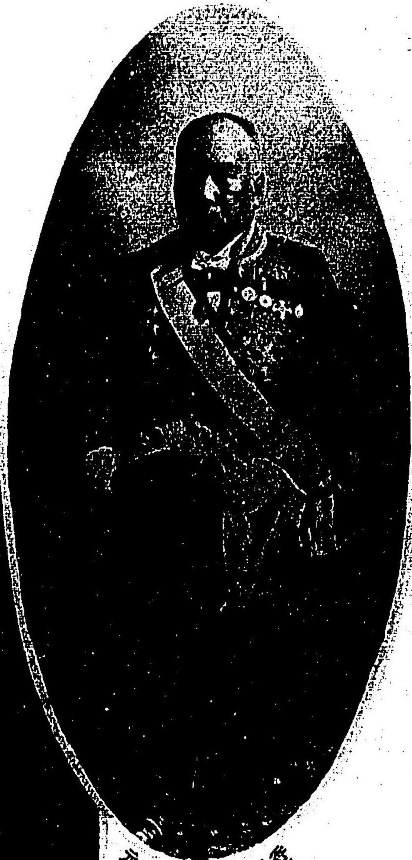
川野三郎 勳三位 從二位 下 兼 陸軍少將