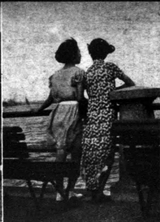
士女二英瑞王芳留顧