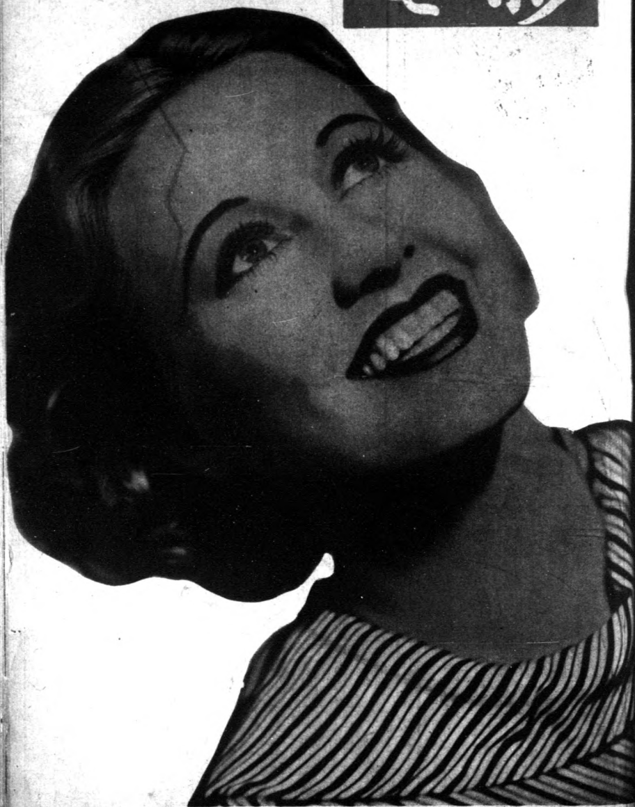
吉妮文吐孃 Genevieve Tobin (W.B.)