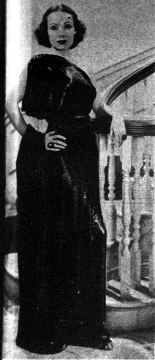
桃樂絲德里奧 Dolores Del Rio