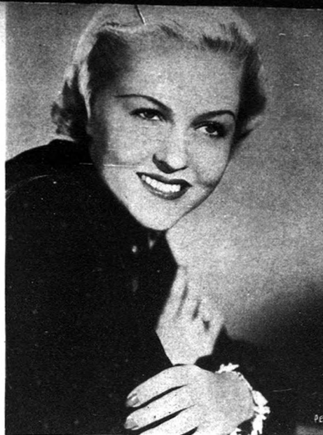
披德茜麗愛莉 Patricia Ellis