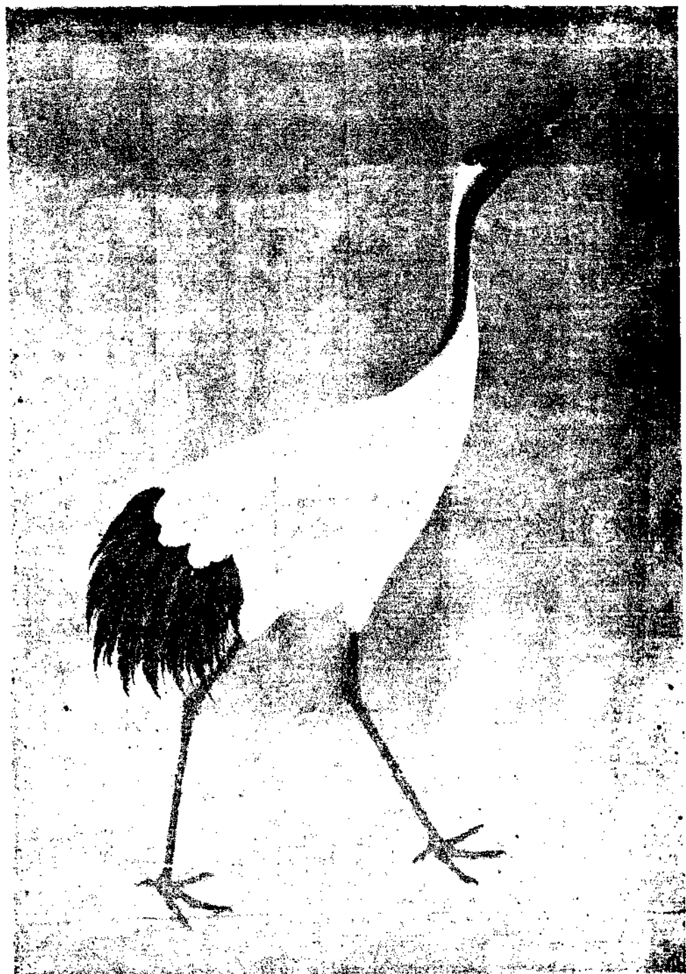
Stork by Emperor Hwei Chung of Sung Dynasty (Part of a long scroll)

至有評為氣象蕭森。烟林晴曠。豪鋒穎脫。墨法精微者。徒以其當時惜墨。遺蹟甚稀。米元章欲作無李論。非無自也。然有名之讀碑窠石圖。圖中人物。有謂為王曉作者。殆亦合作也。(未完)