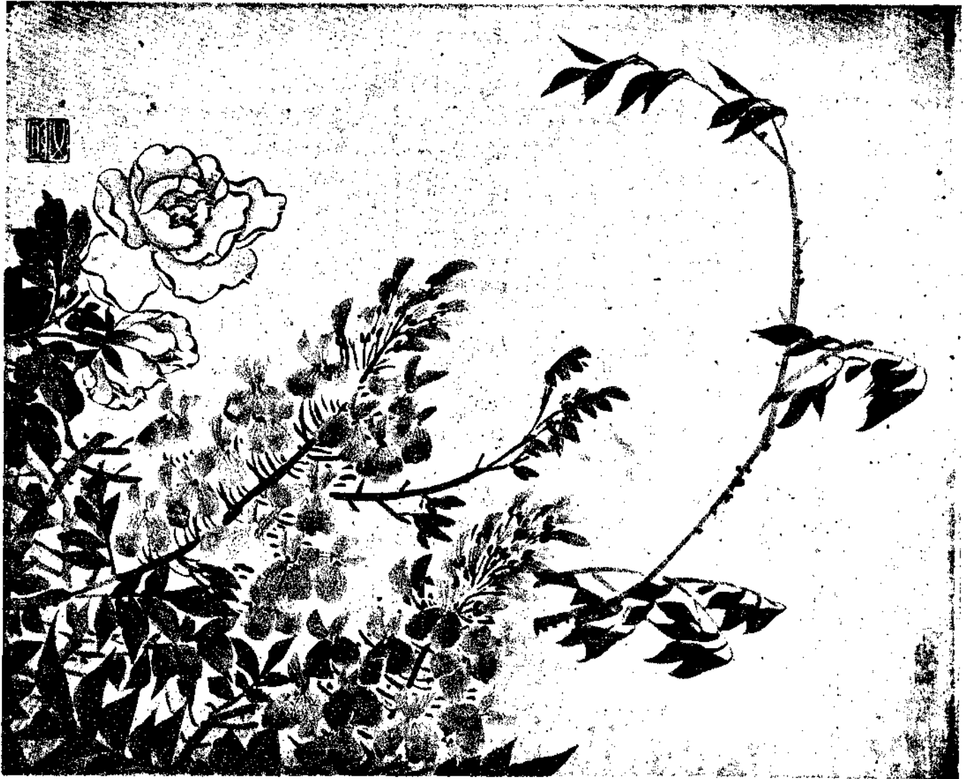
Flower by Mme K. T. Ouang