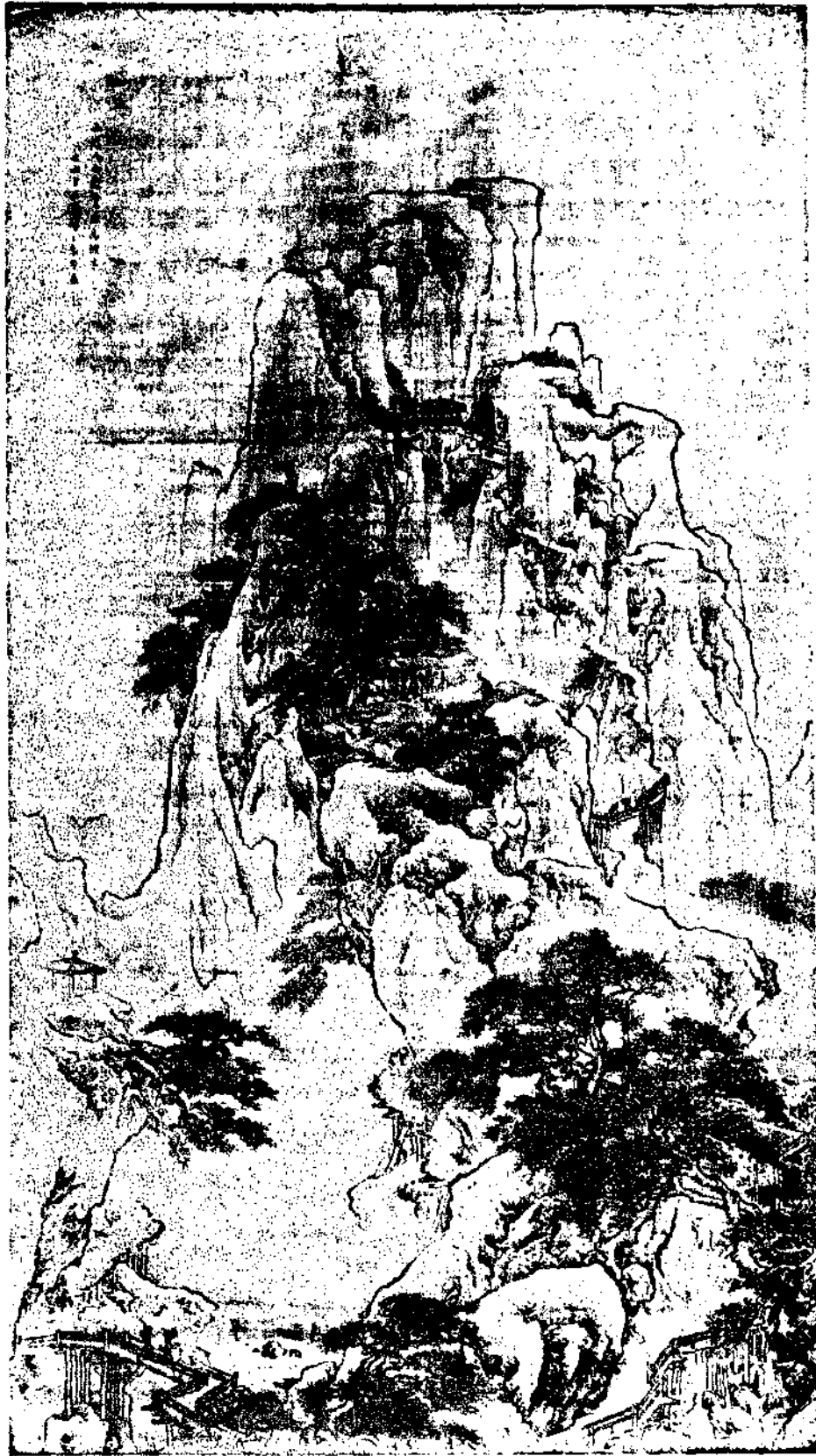
清袁昭道仿宋人山水 Landscape by Yuan Chao Tao of Tsing Dynasty 中華民國二十二年六月一日出版