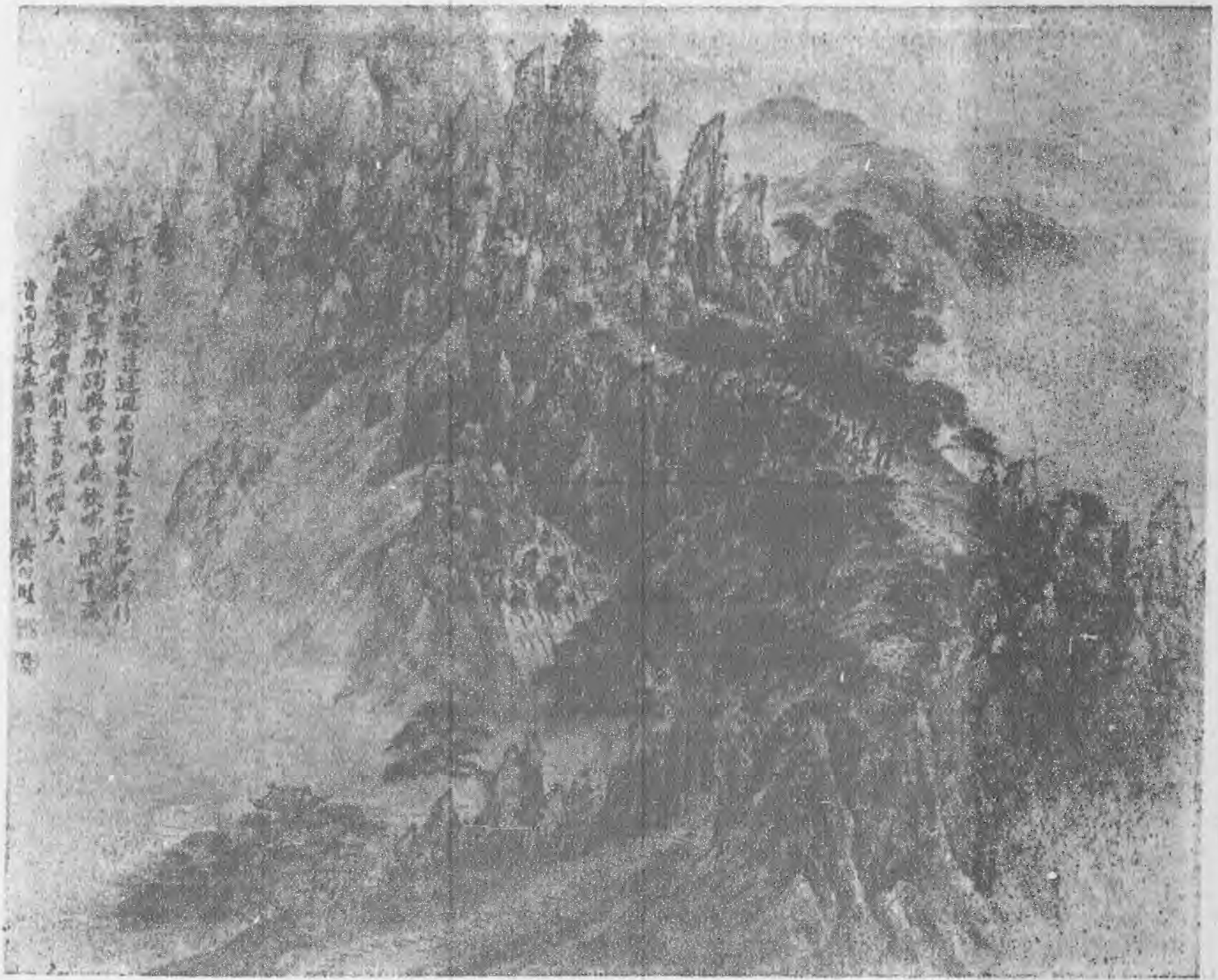
Landscape By Huang Hsiang Chien of Tsing Dynasty.