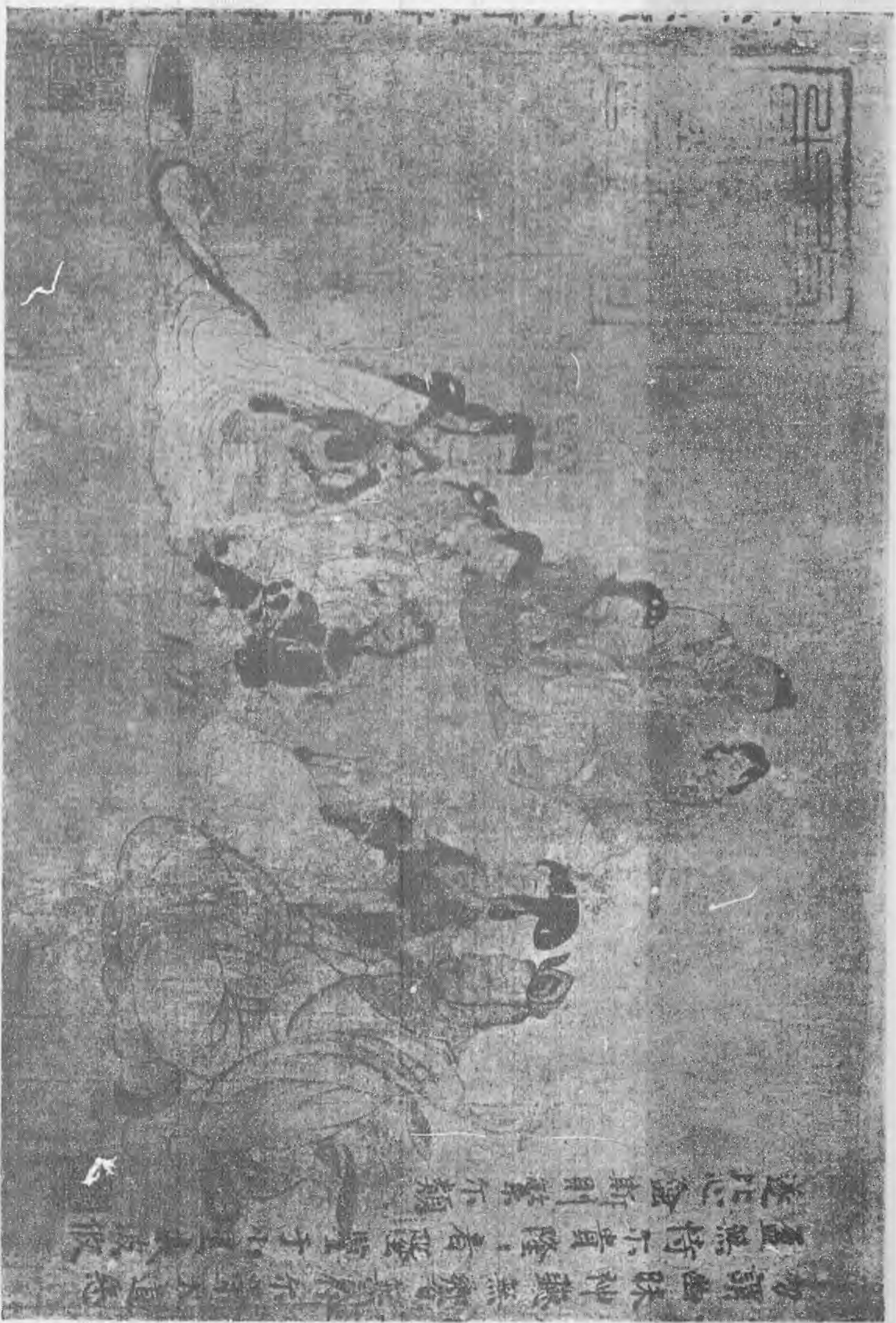
Model woman by Koo Kai Chih of Tsin Dynasty. (No. 7)