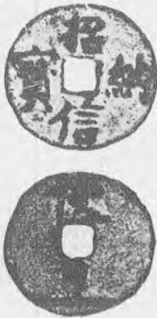
招納信寶背使押文

聽說建炎少元寶况為折二盡人知 常中異品須重往往畢生難遇之 建炎元寶小平錢已各貴一時折二錢部未見之