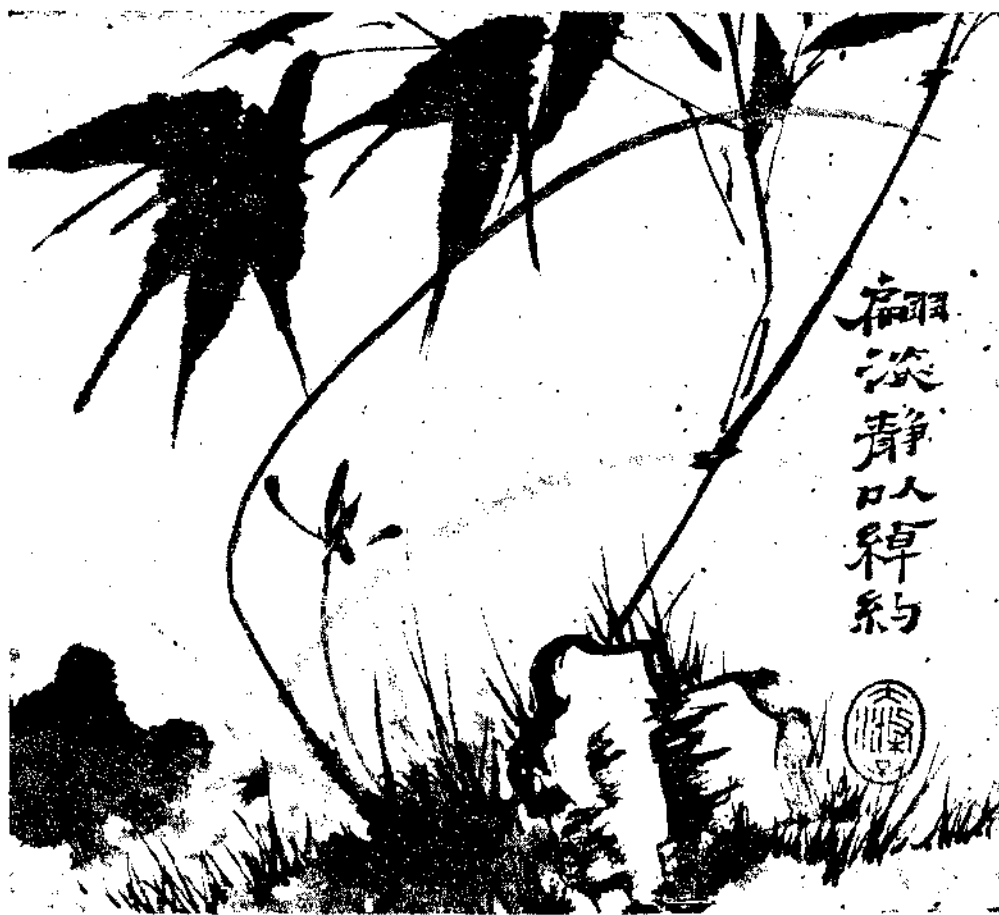
Flowers by Shih Tao, famous monk artist of Tsing Dynasty.

第四行下截首一字。已剝泐不完。當是琴字。而琴字上。應有左字。爲行篤言忠。否則獨善。左琴右書。是言其清高不曠閒也。