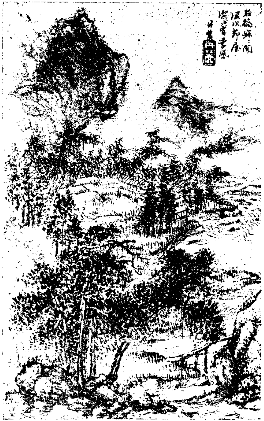
Landscape by Wang Tan Loo of Tsing Dynasty first page. of an album.

古人乾濕互用。粗細折中。用之有工處。有亂頭粗服處也。南宗 扶微。以北宗畫。筆格道勁。渾厚有力。非出筋露骨。令人見而 刺目也。不然。大李將軍。豈得與右丞比肩。而以宗稱之乎。特 蔣三松張平山輩。變亂古法。以驚俗目。效之者。又變本加厲。 相傳有以木工之墨齒。作畫者。以為美談。抑何可笑。若夫南宗 之用筆。似柔非柔。不剛而剛。所謂綿裏針是也。其法不外固厚 。中鋒則圓。出紙即厚。不能解此。見前人之畫。秀潤天成。絕 無劍拔弩張之態。因而柔取之。腕弱筆痴。殊無生氣。類小女子 描花樣者。乃自矜其韶秀。不減於古。奚翅嫻學夫人耶。然從此 平心靜氣。純正練筆。毋求速成。其道就亦未可量。乃不此之務 。要自嫌其筆力孱弱。不足駭衆。急思一捷徑。將筆橫臥紙上。 加意求剛。而枯骨乾柴。污穢滿紙。自詫鐵筆。流俗又從而嘖嘖