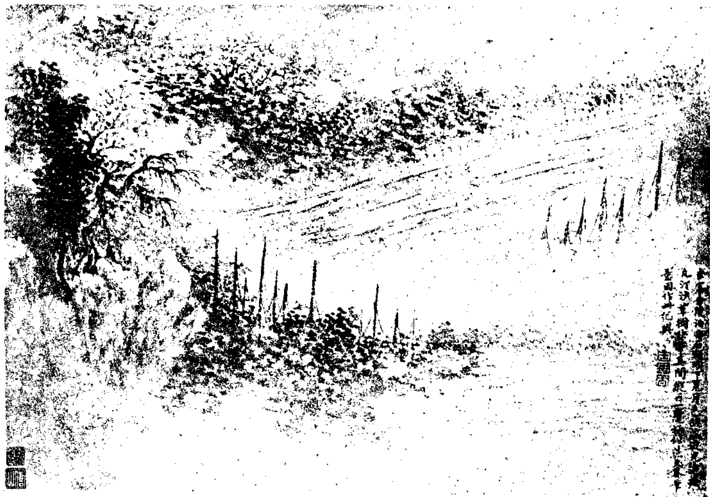
Coloured Landscape by Wang Shih-Kuo of Tsing Dynasty.