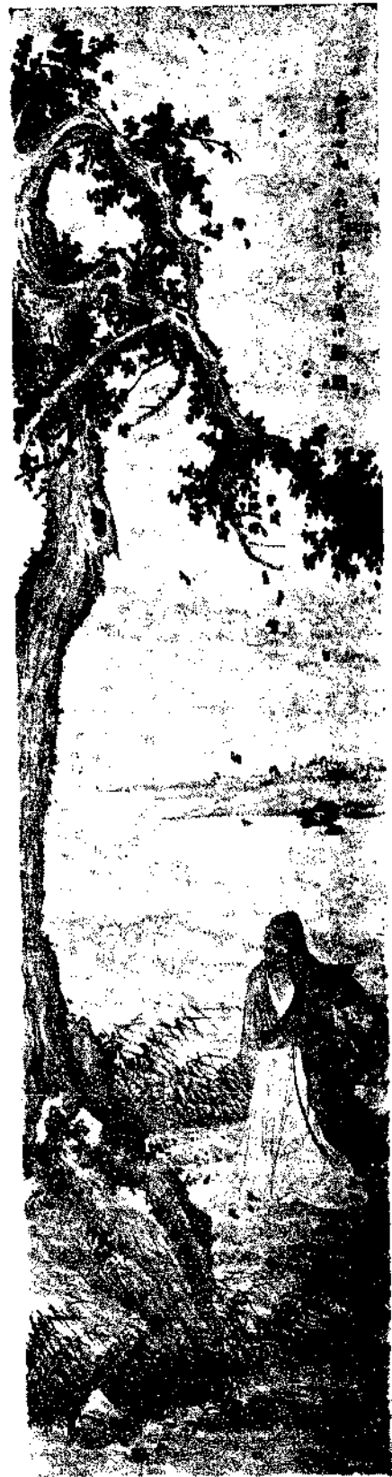
Figure by Chen Shao Mei