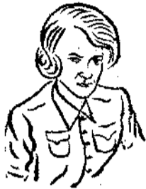
亞斯·里奧奈斯 Aase Lionaes (挪威)

里奧奈斯夫人曾在奧斯陸大學和倫敦經濟學校攻讀，並加入了挪威工人教育協會。在德國佔領時期，她把挪威婦女組織起來，擔任地下工作。德軍正想將她逮捕，她却順利地逃入瑞典去了。解放後她被選為挪威工黨婦女會主席。挪威婦女有參政權，和男人一樣。里奧奈斯夫人現正努力工作，目標在使婦女能得到和男人相同的工資。她有個六歲的女兒。