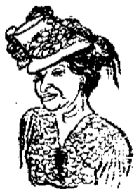
亞曼德·拉巴卡 Amanda Labarca (智利)

亞曼德·品托·地·拉巴卡·赫伯遜夫人是智利最有名，經歷最多的教育家兼教育著作家。她曾在智利大學，美國哥倫比亞大學和巴黎梭朋大學攻讀，現任智利婦女同盟主席，領導着爭取選舉權的運動（現