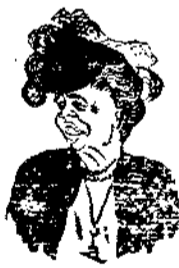
伊蓮娜·羅斯福 Eleanor Roosevelt (美國)

羅斯福夫人底勇氣、勤勞和對世界大勢的專門學識博得了所有同事底一致敬佩。本年一月，在全場歡呼之下，她被選為聯合國人權委員會主席。國際難民機構也是在她堅持之下組織成功的。在關於男女平等的辯論當中，她要求「更多的行動」而寧願不要「更多的言語」。她說過：「聯合國是世界底喉舌，所以婦女必須是它底一部份。」