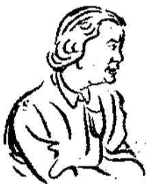
波委·伯脫立 Bodil Bestrup (丹麥)

伯脫立夫人是哥本哈根大學畢業生，聯合國大會婦女地位次委會主席，又是「呼籲聯合國會員國採取手段達成男女平等」決議案底起草人。她曾任丹麥全國婦女會主席，一九三八年