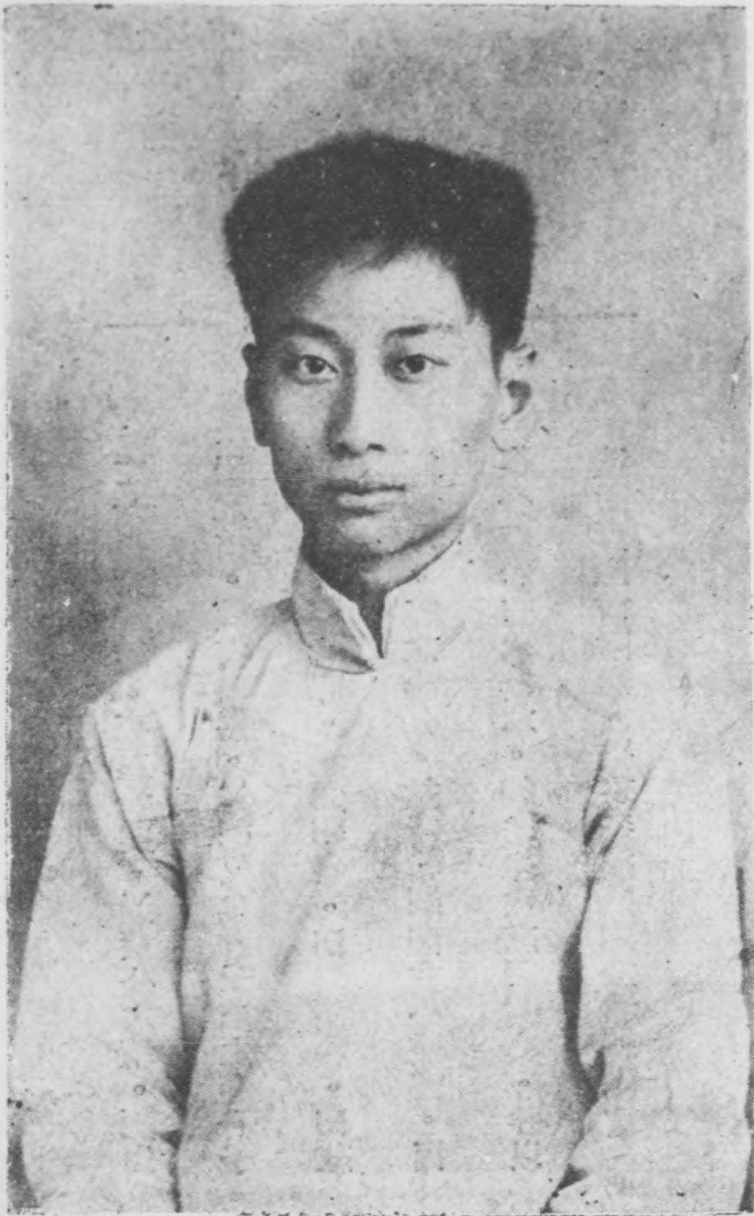
朱 鴛 雛 遺 像