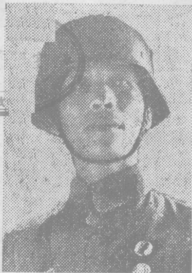
孤軍 政 守之謝團長