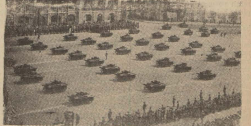
Sovyet tankları bir geçit resminde (Yazısı 5 incede)

Bir Sovyet tank alayı tamamen imha edildi