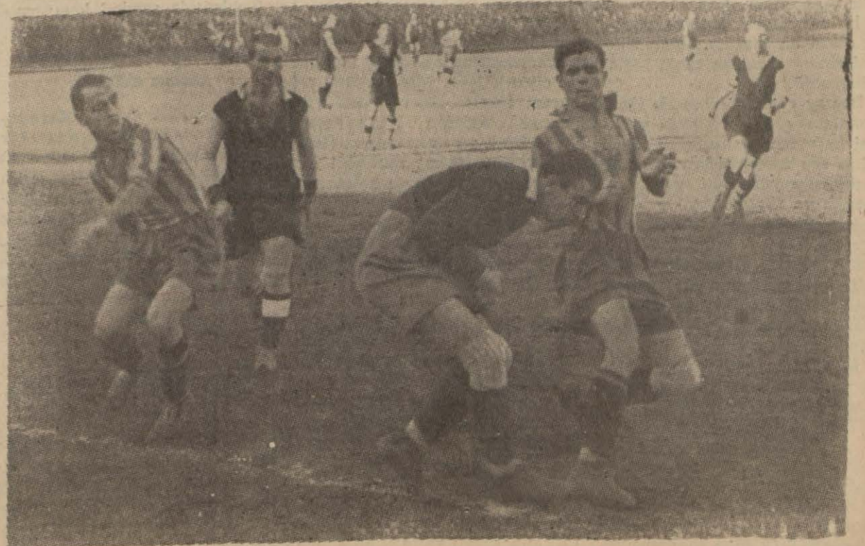
Dünöü Galatasaray — Beşiktaş maçından güzel bir enstantâne (Yazısı 3 incede)

Galatasaray Beşiktaş 3-0 yendi Fenerbahçe de Perayı 1-0 kazandı Askerî liseler şampiyonasını Kuleli kazandı