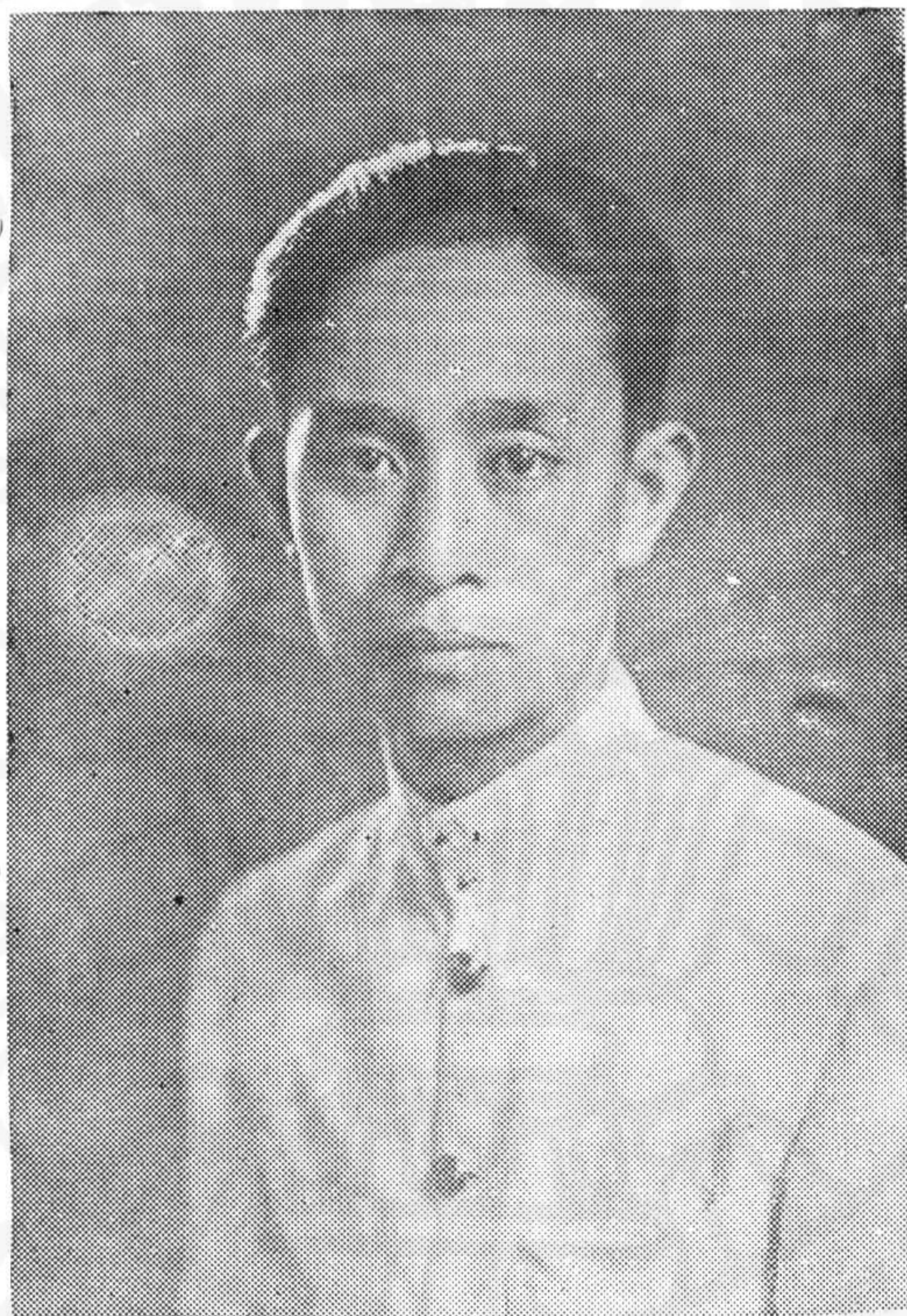
รองอำมาตย์เอก ขาบ อภัยวงศ์