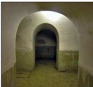
Vista transversal de tres salas del refugio