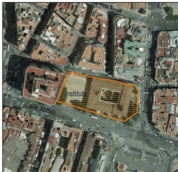
Foto aérea 2008 SIGESPA con ámbito arqueológico propuesto o refugio