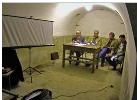
Actividad cultural celebrada en el refugio