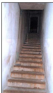
Escalera de acceso actual

En las reformas llevadas a cabo se han enlucido las paredes y se han pintado. En algunas ocasiones se realizan actos culturales en el mismo.