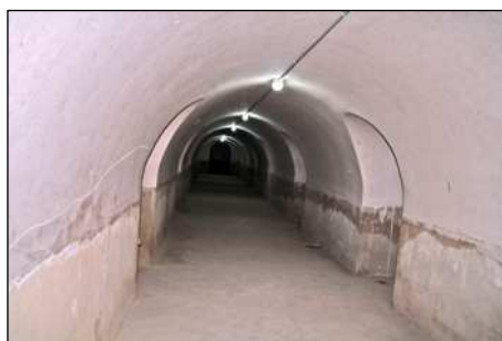
Vista de una de las salas del refugio