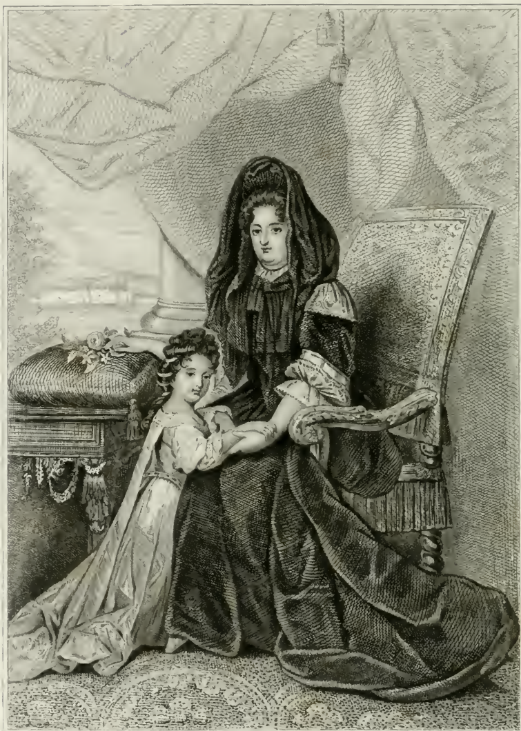
WELCOME TO THE WEDDING