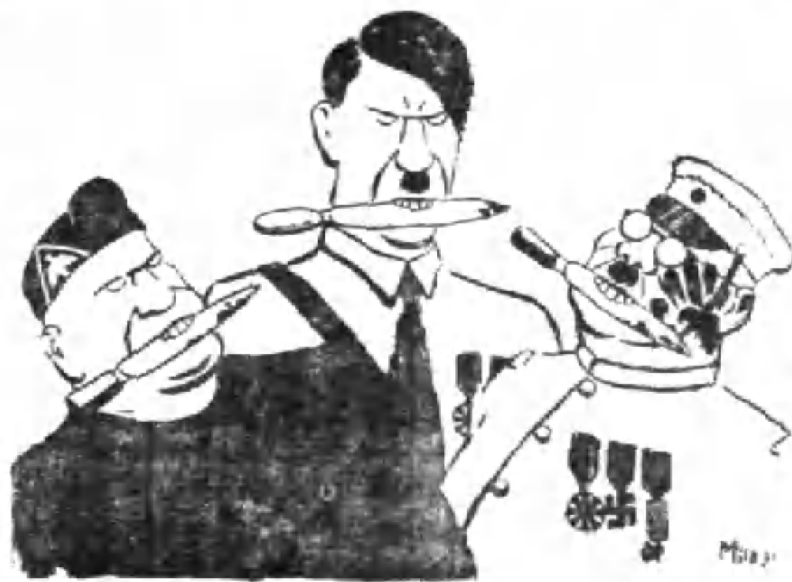
國際間三個子創手

儘管德意日法西斯加緊破壞世界和平，儘管他們一步步玩弄大英帝國，從而却掠其利益，可是頑固的張伯倫却始終不會稍稍改變他的反動政策，仍舊縱容鼓勵侵略者的進攻，甚至還跟他們同謀宰割一些被侵略的弱小者，以圖保全其利益和自身