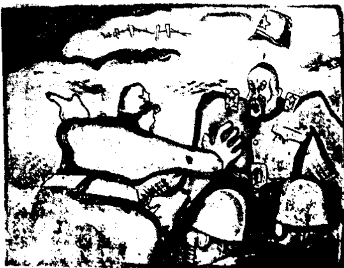
陣地被那支兵衝破了！快放毒氣！

取締之法，莫善於限制價格，定一最高價，使其寒心，彼輩明知不再有更高價格的希望。反可促其出售，使紗價下落。但施行時，有二個條件：(一)須調查有無囤積之事實，(二)限價須隨時加減。因棉紗數量實際上因感不足時，限價必須變更，否則數量愈少，紗價愈高。或數量實際須逐漸增加時，限價必落，否則反促成居奇之現象也。