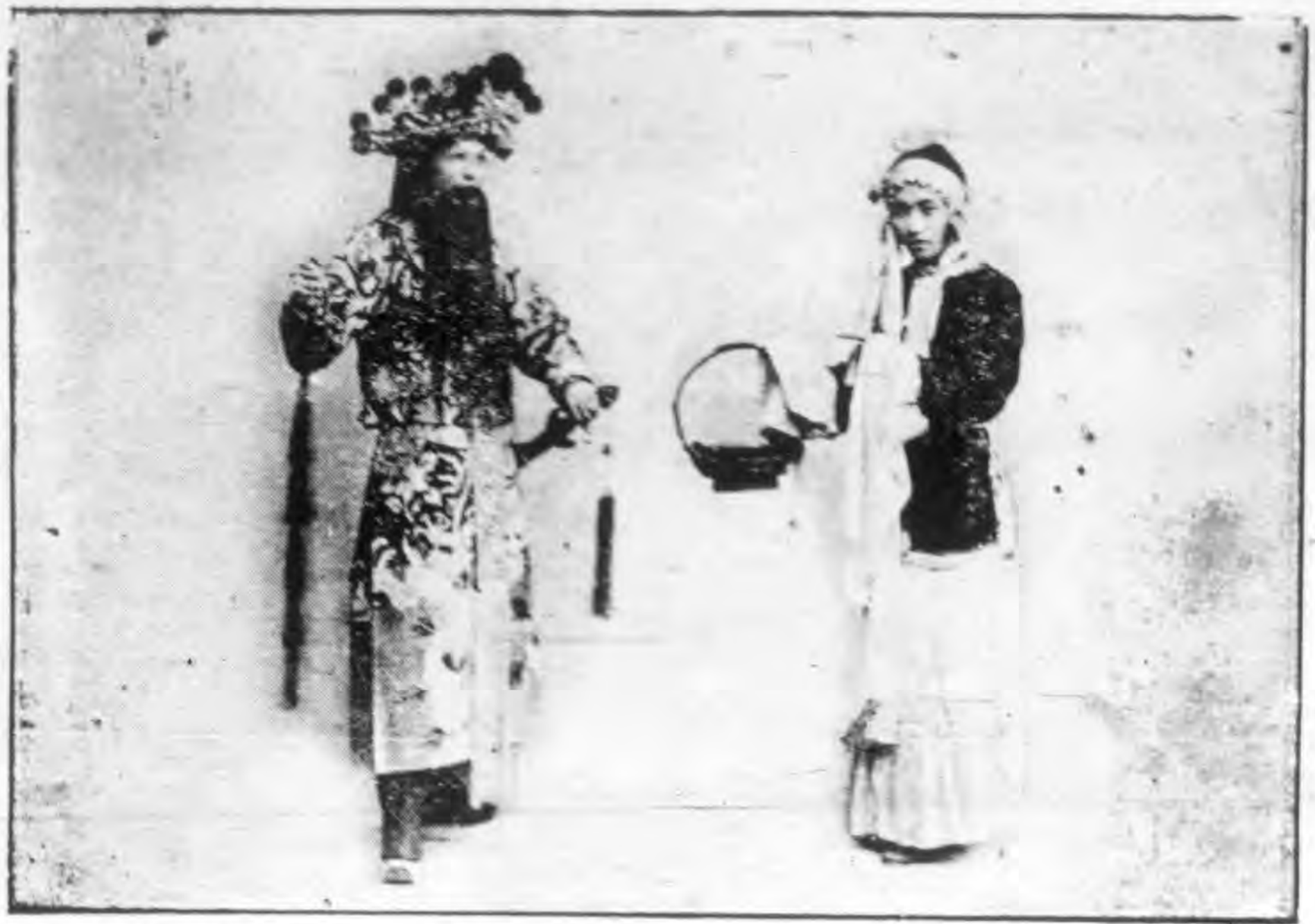
吾 譏 陸 坡 家 武 衫 陽 歐