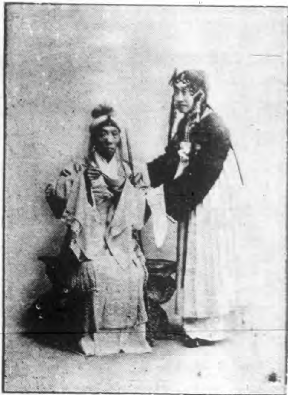
（曲崑）卷 羊 牧 補 少 施 君 童