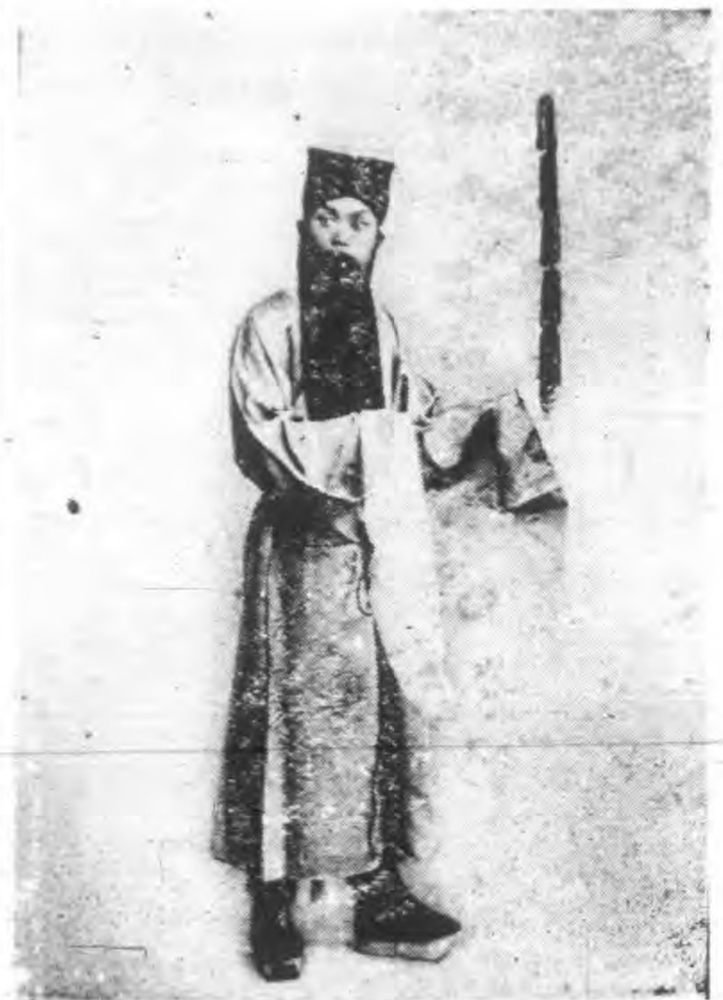
山 靜 王 放 捉