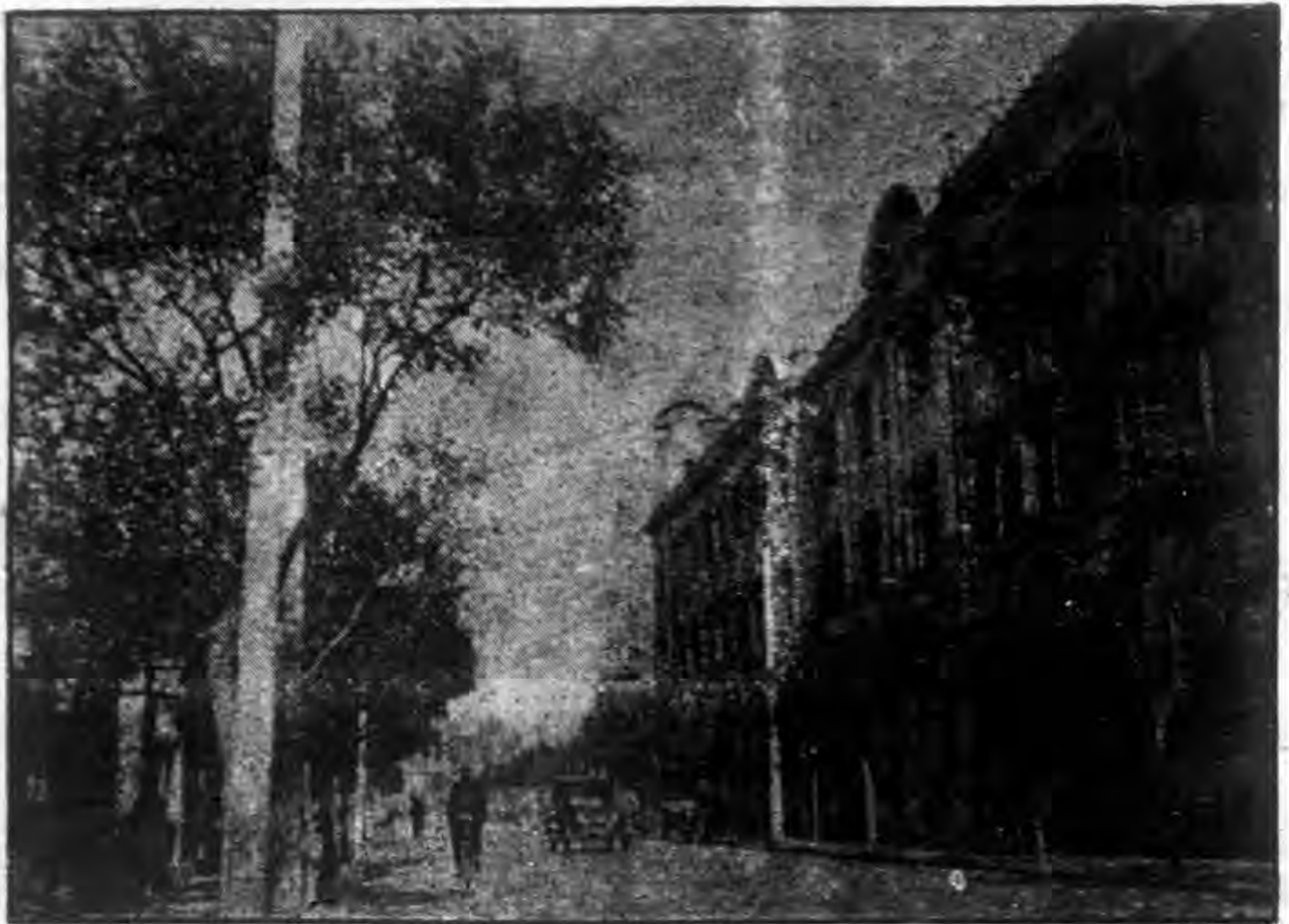
天津電報局 羅良宜攝