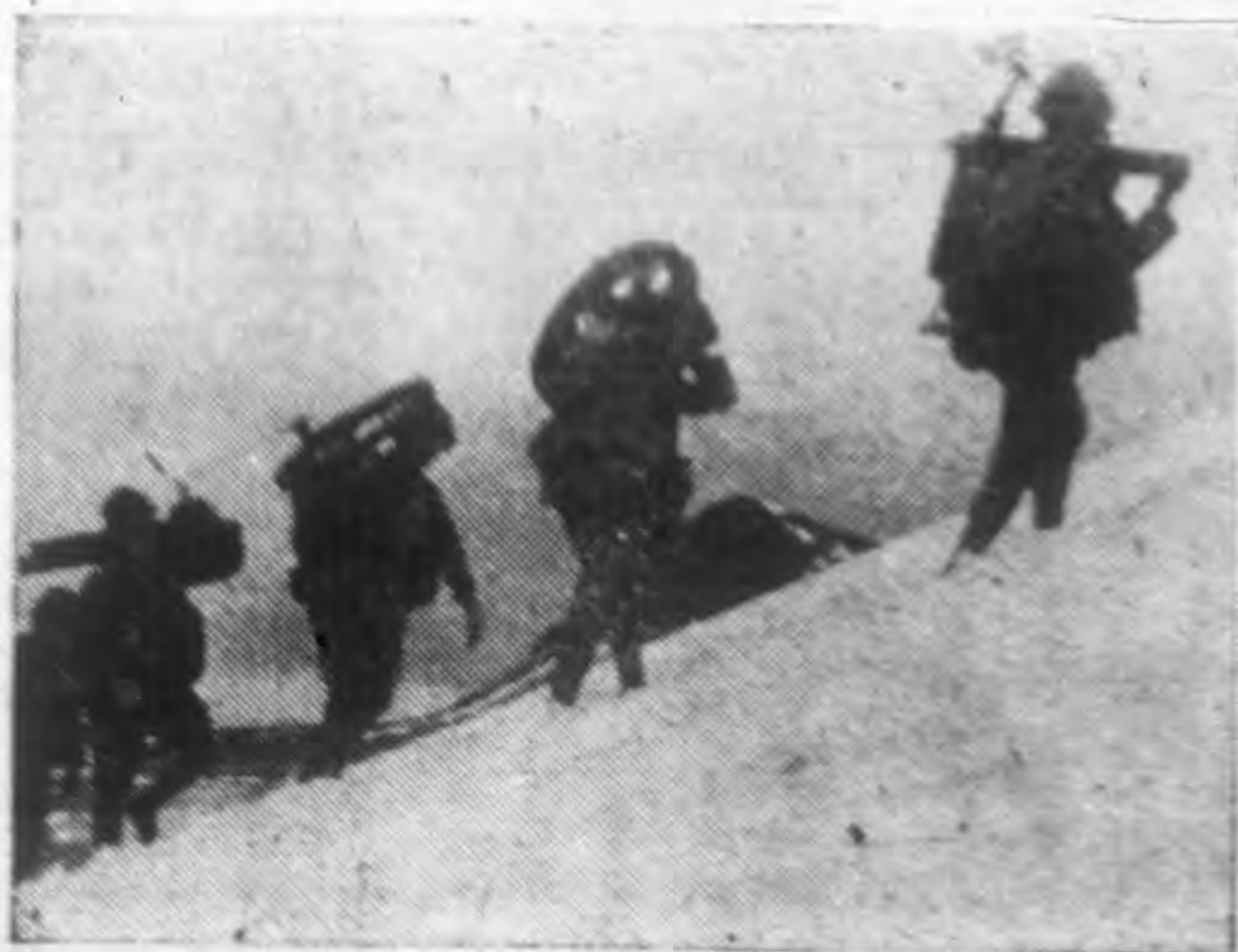
← 威壓北太平洋佔領阿留申安群 島之日軍砲隊勇士把○○砲分 解運向險峻之白雪山峰