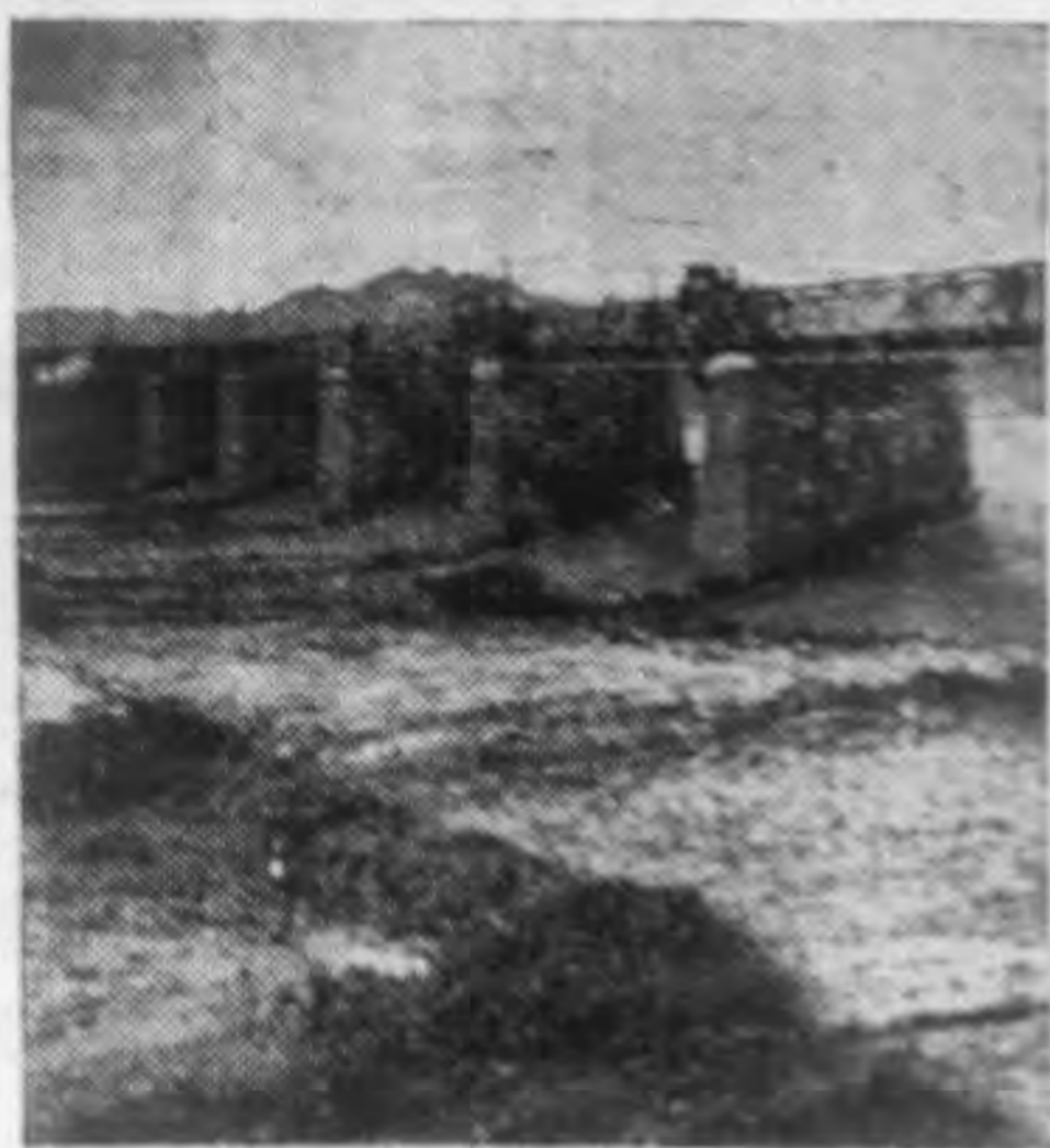
永定河下游之水勢 →