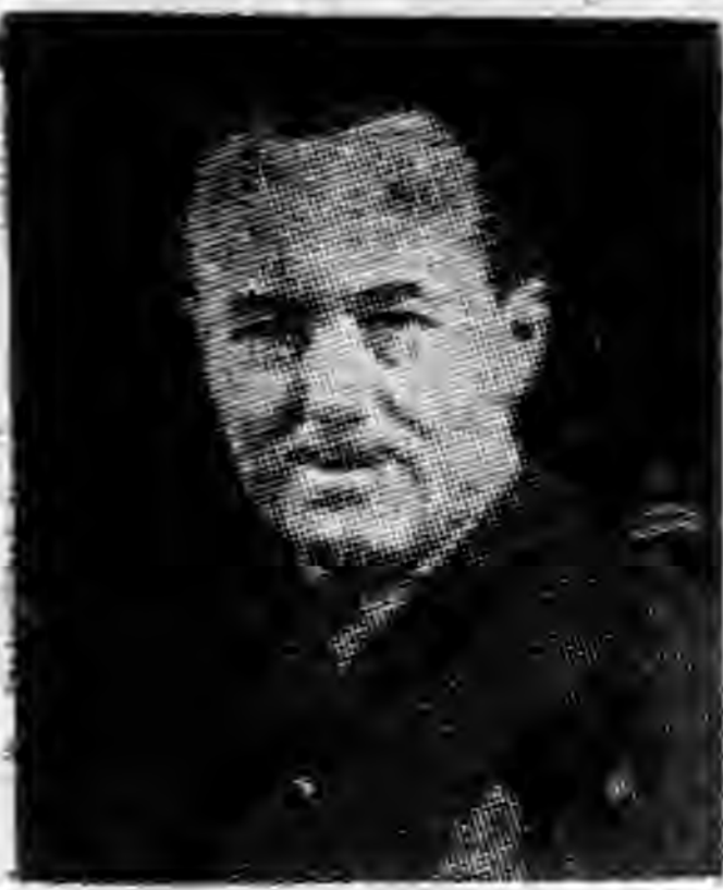
羅 易 霍 華 德

紐約時報是美國最大最有力量力的報紙。它創辦於一八五一年，現在由蘇次貝主持着，平日銷數四十五萬份，星期日超出七十萬份。他的通訊網密佈國內