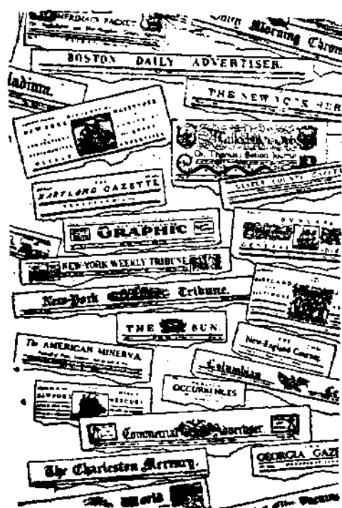
美國報紙數量衆多五花八門

分之五十，廣告費也隨着增加。但因發行額的增加，所登的廣告能獲得更多的讀者，商人們認為是很上算的事。一九四一年每行廣告代價，是一百二十九元〇七分，可以獲得四千二百萬讀者。在一九四五年，每行廣告，要一百四十元五角七分，但讀者可有四千八百萬之多。