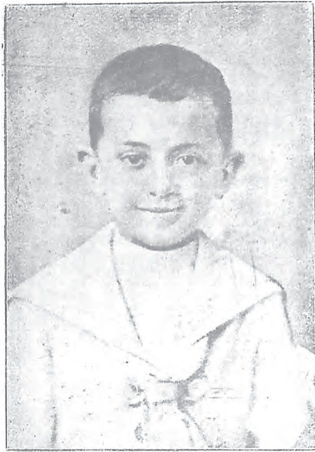
愛德小兒在初領聖體日留影