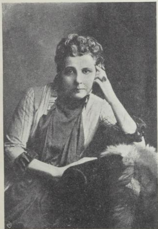
Annie Besant i 1880-årene.