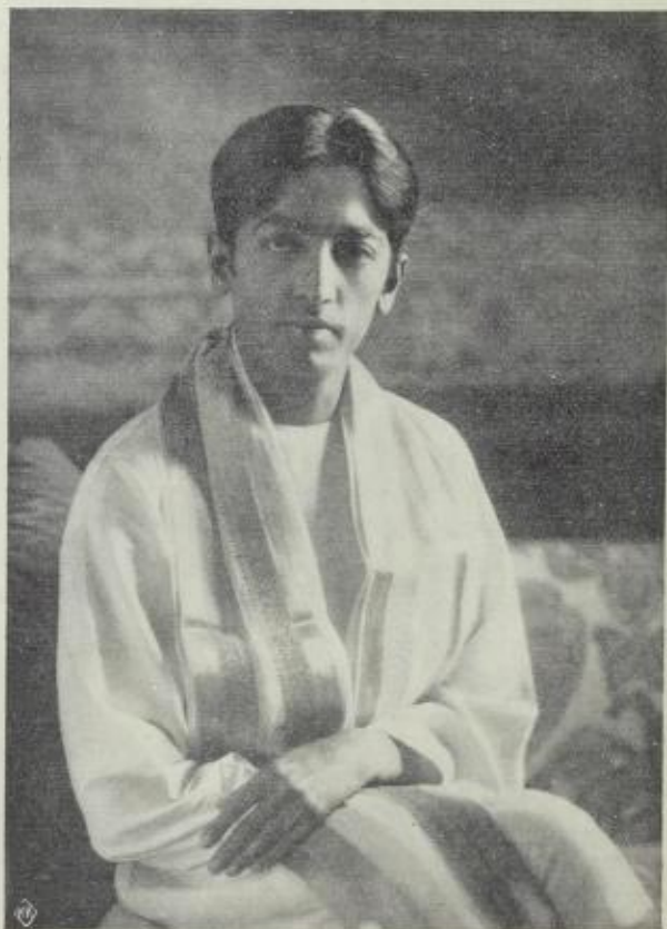
J. Krishnamurti, 1926.