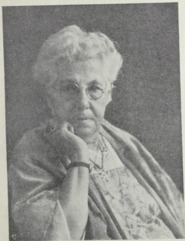
Nyeste billede av Annie Besant.